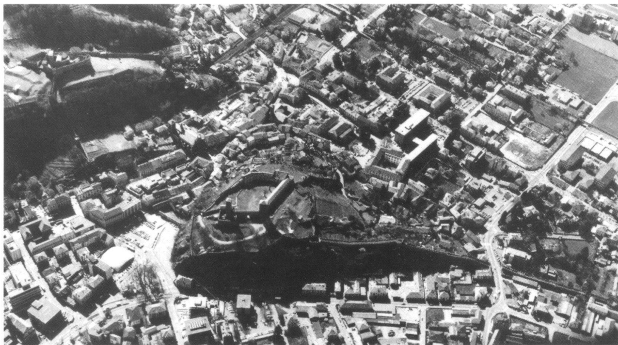
Bellinzona, verrou sud du Gothard. La Muratta, un «lezzi du XV e siècle perfectionné par les Visconti (Photo Stuart Morgan).