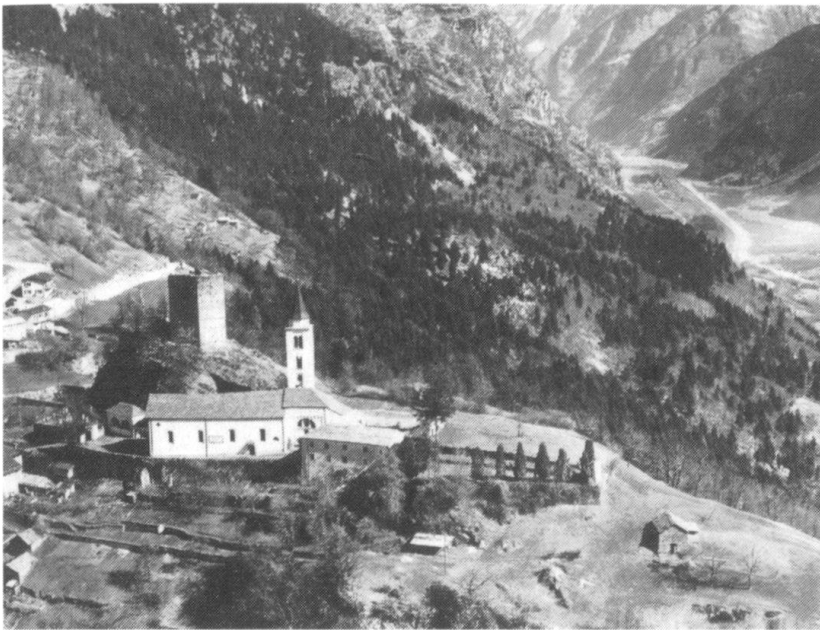
Un site typiquement rhétique, Santa Maria in Calanca.

peeler que le colloque fut introduit par le brillant exposé transpériodique du général Bertinaria, «La guerre en montagne, philosophie, principes, technique» et à citer dans l'ordre des interventions les noms, que les