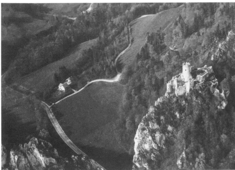
Ruines du château de Neu-Frankenstein (XII e siècle) qui contrôlait la route stratégique du Passwang entre Balsthal et le Birsthal.