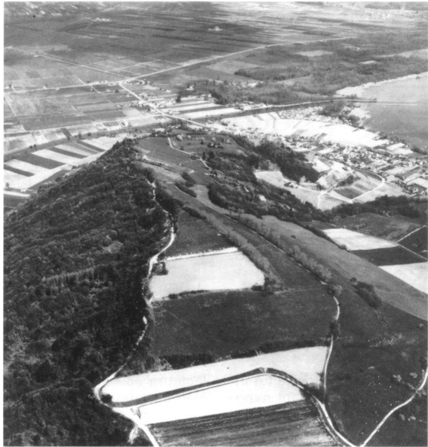
Le Vully, un «Alésia» helvétique. Avant la fondation d'Avenches, il s'y trouvait un oppidum helvète.

A cet égard s'impose la comparaison avec la guerre navale, et entre montagnard et homme de mer. Toutefois, il n'y a pas de coupure entre la guerre de montagne et les autres types de guerre terrestre. Peut-être ne s'est-on pas suffisamment interrogé sur le seuil par lequel on passe de l'une à l'autre. Quand rencontre-t-on les caractéristiques propres à la montagne, altitude, pente des reliefs? Bien des régions accidentées présentent quelques-uns des caractères de la montagne et sont propices à la petite guerre. La forme des montagnes est également à prendre en considération, massifs inhospitaliers mais isolables, chaînes difficiles à contourner, formant frontières naturelles. Il en est de même pour les zones climatiques. Sous les tropiques, l'altitude rend la montagne plus saine et moins hostile que les plaines marécageuses. Il a été souvent question à juste titre des abords de la montagne, rivages beaux