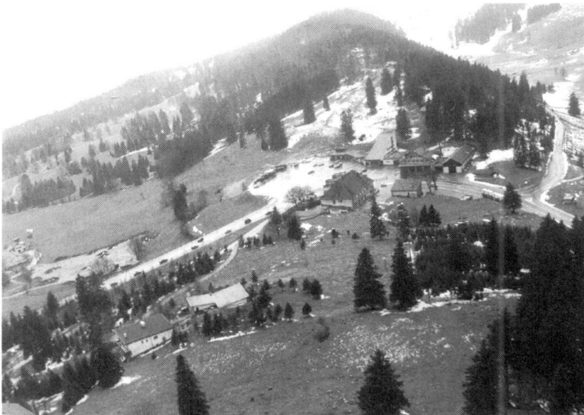
Le col de la Vue-des-Alpes pendant des manœuvres de la Brigade frontière 2 en 1989.

Tout au long du service actif, ces mesures ont assuré au commandant en chef la liberté d'action indispensable à la réalisation des plans de relève et de ses intentions opératives. Ces dispositions n'ont pas éliminé les problèmes que pose l'engagement coordonné de troupes frontière et de formations de l'armée de campagne, les différences au niveau de l'articulation et de l'équipement n'assurant pas l'interopérabilité et la complémentarité.