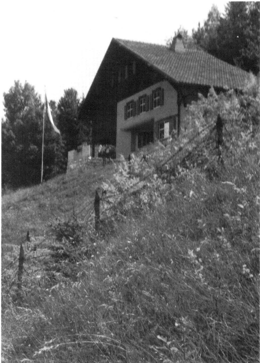
Ce chalet «inoffensif», un des ouvrages du Pré-Giroud édifié à la veille de la Seconde Guerre mondiale dans le secteur de Vallorbe.

Les brigades de montagne, qui étaient en fait des «grandes divisions», perdent leurs troupes de forte-