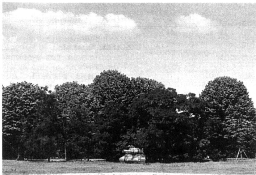
Leurre en deux dimensions (2D). Il s'agit d'un panneau représentant un char AMX-30. Il pèse 45 kg et peut être mis en place en 15 minutes. Des sources de chaleur aux chenilles et à l'emplacement du pilote permettent de lui donner une signature thermique similaire à l'original.

La déception comprend le leurrage sur toute la palette des senseurs évoqués plus haut. On peut distinguer le leurrage technique et le leurrage tactique/opérationnel. Le leurrage technique a pour but de saturer