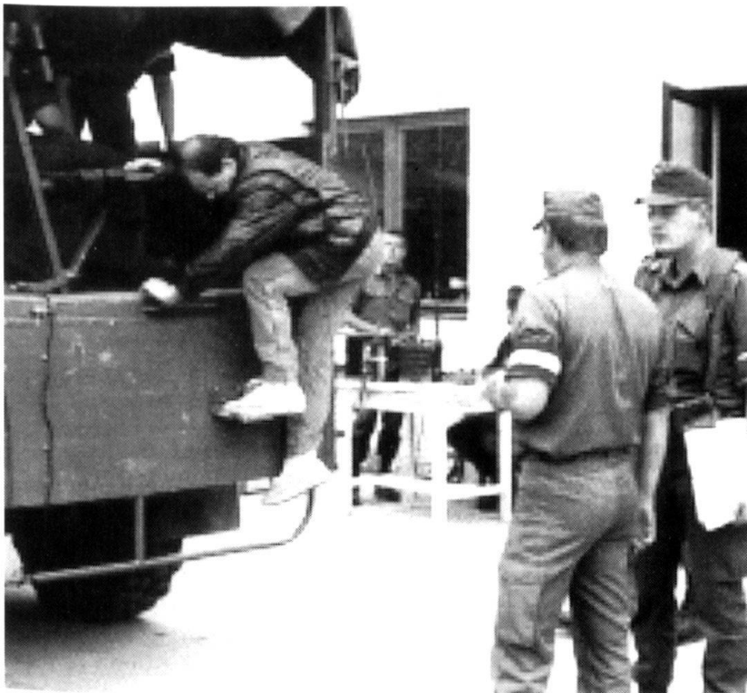
Si nécessaire, la Bundesheer recueille et s'occupe de réfugiés, un problème que l'autorité civile ne peut plus gérer vu l'afflux.

Si la menace s'aggrave à la frontière ou si l'opération s'étend dans la durée, on engage des forces rapidement disponibles supplémentaires. La procédure de décision est accélérée. Au besoin, ces forces sont prises dans les formations opératives qui sont limitées à un maximum de 5000 hommes. Pour accélérer la constitution de ces forces, des formations précises sont maintenues temporairement avec le statut de formations de couverture frontière de milice. Elles sont en tout temps rapide-