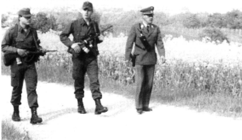
... Des soldats patrouillent avec les garde-frontière.

Les forces de présence sont principalement constituées par des relèves de corps de troupes, complets ou partiellement mis sur pied dans leurs structures du temps de paix, qui sont organisés en fonction de la situation et de missions précises (missions de présence), conformément à la composition et à l'ordre de bataille spécifiques à chaque arme.