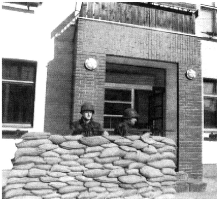
Lors d'un service d'appui aux autorités civiles, la Bundesheer prend en charge des missions de garde d'objets sensibles.

L'engagement de forces rapidement disponibles et,