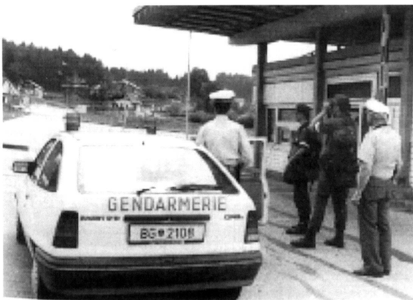
Comme l'armée suisse, la Bundesheer peut être appelée à renforcer les gardes-frontière...

Dans la défense combinée, il s'avère parfois nécessaire de subordonner à un commandant militaire plusieurs groupements de la force d'un bataillon, de lui assigner des missions de conduite tactique, comme la flanc-garde du dispositif, le combat contre des troupes aéroportées ou des missions en relation avec la protection territoriale.