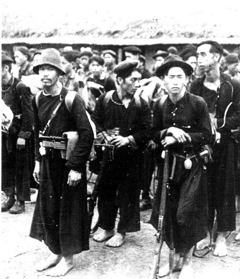
Laos, Khang Khai, 30 avril 1954. Les partisans Méos prêts pour l'OPS «D» au profit de Dien Bien Phu.

tionnés parce qu'ils aiment le travail en solitaire, qu'ils savent survivre avec ce dont ils disposent sur place et prendre des initiatives. Ce sont des hommes qui n'accordent d'importance qu'à ce qui peut leur être utile dans le cadre de la guérilla. Il ne faut pas faire trop de distinctions entre «spéciaux» et militaires.