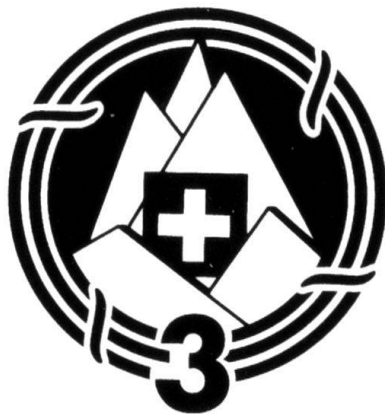
L'insigne du corps d'armée de montagne 3.

Le Simplon voit alors son importance fortement décliner et la route qui put s'enorgueillir à une époque du titre de «Reichsstrasse» est délaissée. Endormi pendant un siècle et demi, le passage retrouve vie avec l'activité extraordinaire de Kaspar-Jodok Stockalper dont les succès rapides en affaires illustrent bien «l'irruption du capitalisme marchand dans le transit alpin». Tirant profit de la demande surabondante qui suit la Guerre de Trente ans et de la rivalité franco-espagnole, il devient transitaire, banquier, exploitant de mines et constructeurs de routes, édifiant une fortune considérable qui le fait appeler «le roi du Simplon». Cet homme trop puissant, qui a élevé Brigue au rang de ville et développé le Haut-Valais, chute brutalement le 24 mai 1678, victime en premier lieu de trop de jalousies. Dépossédé par le Landrat de toutes ses fonctions et nombreuses dignités, ainsi que d'une grande partie de ses biens, il doit, pour sauver sa vie, s'enfuir à Domodossola.