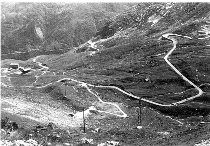
A part le Simplon, les troupes romandes sont aussi concernées par le Grand Saint-Bernard.

Avec l'armée 95 et la notion de défense dynamique du territoire, les brigades frontière et de réduit ont été supprimées. Ce choix n'implique en aucune façon un affaiblissement de notre frontière Sud, partant de la transversale alpine du Simplon, bien au contraire. La grande différence réside dans la possibilité désormais offerte de marquer davantage des efforts principaux en telle ou telle partie du territoire, sans être forcément fixé ou lié à un secteur ou à un terrain. Pour faire face à une menace Sud dans un cas de défense, des troupes dites librement disponibles pourraient être amenées à remplir dans le secteur du Simplon des missions de barrage ou de protection; elles seraient probablement plus