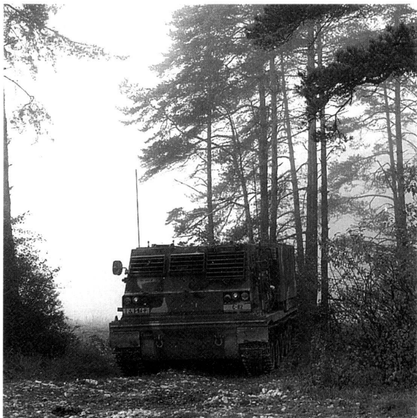
Un LMRS en position.

Avec nos excuses, nous rétablissons le texte: «C'est seulement vers l'an 2000 que l'on songe [en Suisse] à l'acquisition d'une artillerie opérative (...). Le LMRS ferait l'affaire, la comparaison parle d'elle-même: en une minute, un groupe d'obusiers blindés (18 pièces) tire 90 coups avec une efficacité au but de 5670 bombles. Une section LMRS (4 pièces) tire 48 coups avec une efficacité au but de 30193 bombles.» (Réd.)