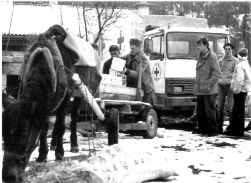
Bosnie-Herzégovine, Polje: chargement de vivres sur des charrettes tirées par des chevaux pour ravitailler des villages éloignés autour de Brgelic (Photo Jessica Barry, CICR).

D'Afrique, proviennent chaque jour des nouvelles faisant état de rivalités pour