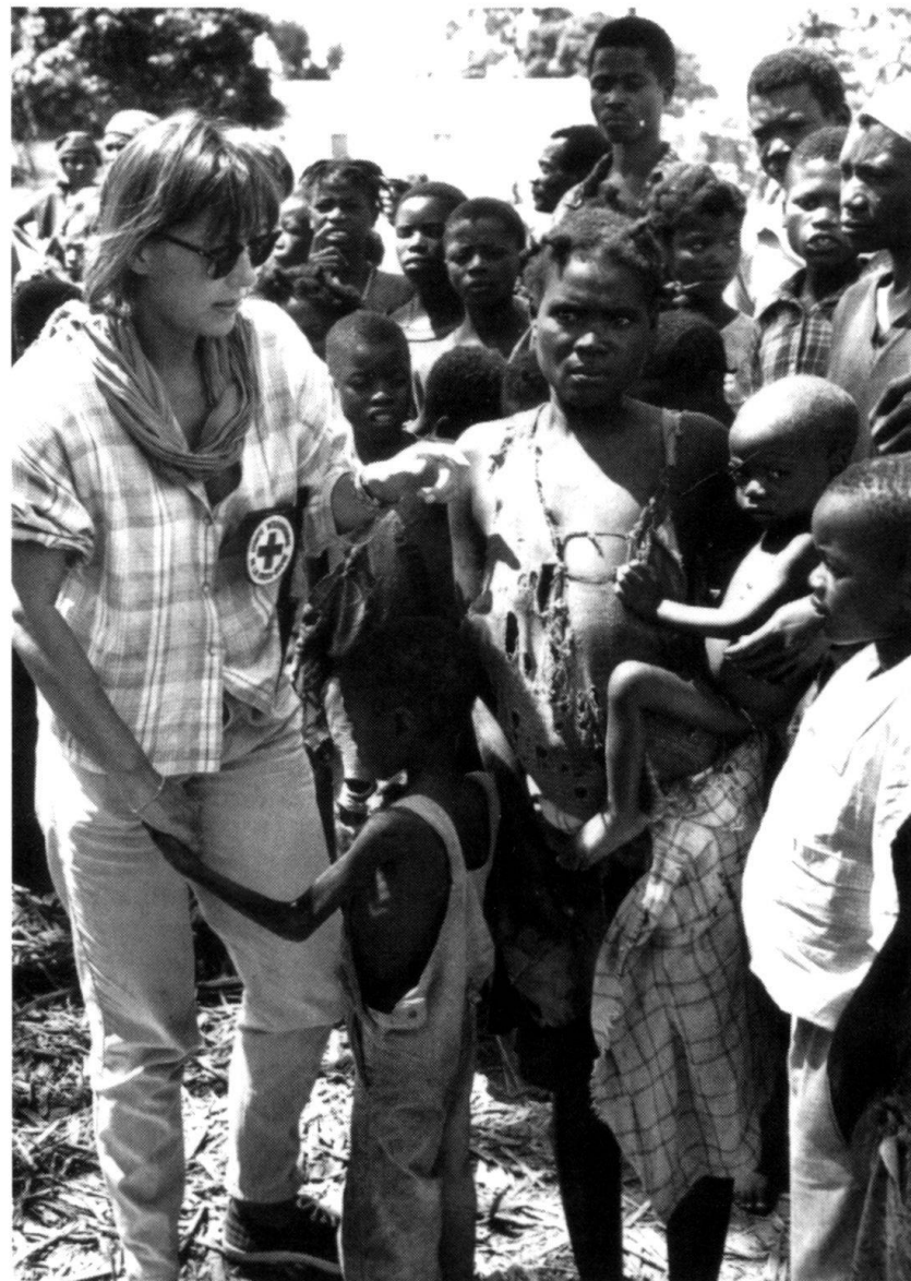
Angola 1994: Malnutrition grave. Le CICR est sur place depuis dix jours seulement. La ville est encerclée. Les paysans ne peuvent plus se rendre aux champs. Cette région était le grenier de l'Angola.

Il est néanmoins important d'observer les caractéristiques essentielles de l'opération humanitaire. Elle doit, avant tout, tendre à porter secours à des individus ou à des groupes de personnes qui se trouvent physiquement ou psychologiquement dans le besoin, et ceci dans des situations d'urgence. Elle doit toujours impliquer un élément de protection, c'est-à-dire de sauvegarde de la dignité humaine. En outre, l'aide humanitaire doit être indépendante de toute action politique, elle doit être impartiale, c'est-à-dire sans distinction de race, de religion, de nationalité ou de classe sociale. C'est ainsi qu'ont agi les femmes lombardes, rassemblées en 1859 par Henry Dunant après la bataille de Solferino : « Siamo tutti fratelli » disaient-elles, en portant secours aux blessés.