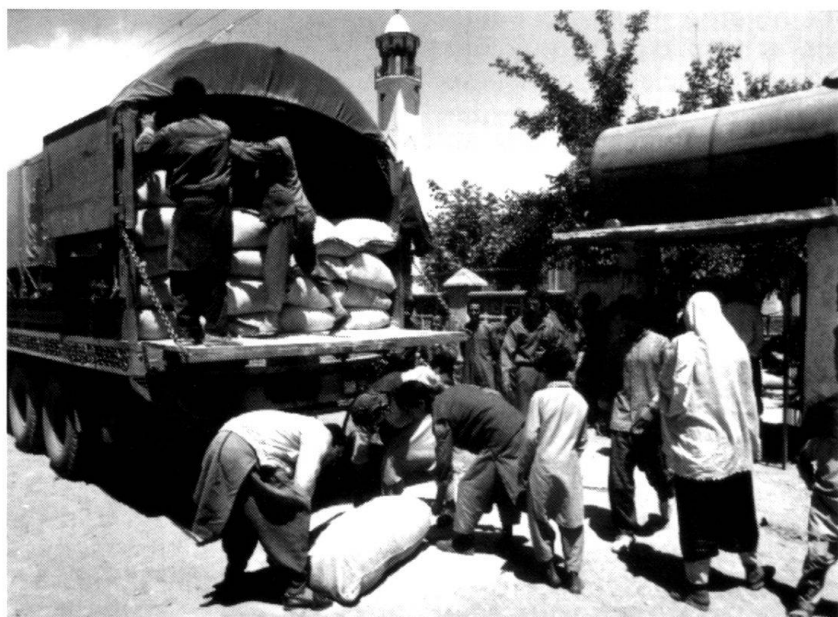
Afghanistan 1994, Kaboul: distribution de farine à la mosquée de Hazrate Ghous Sakalain dans le quartier de Khair Khana à des personnes déplacées.

A ce jour, le CICR n'avait jamais rencontré autant d'obstacles pour avoir accès aux forces qui détiennent le pouvoir et aux factions en lutte, afin d'obtenir le respect des dispositions du droit international humanitaire ; jamais encore cet accès n'avait été autant entravé par la désintégration de l'autorité gouvernementale, voire sa dispari-