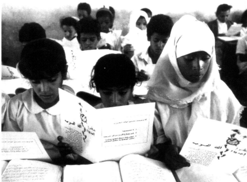
Yemen 1995: Volontaires du Croissant-Rouge yéménite expliquant le danger des mines à des écoliers.

Il est donc indispensable d'éduquer, dès le plus jeune âge, à la solidarité et à la tolérance. En d'autres ter-