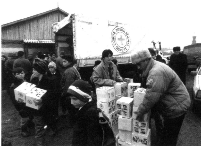
Tchéchénie: distribution de colis humanitaires à des habitants d'un village à 40 km au nord-est de Grozny.

Dès lors, une question s'impose : quelle forme de politique la communauté internationale est-elle en