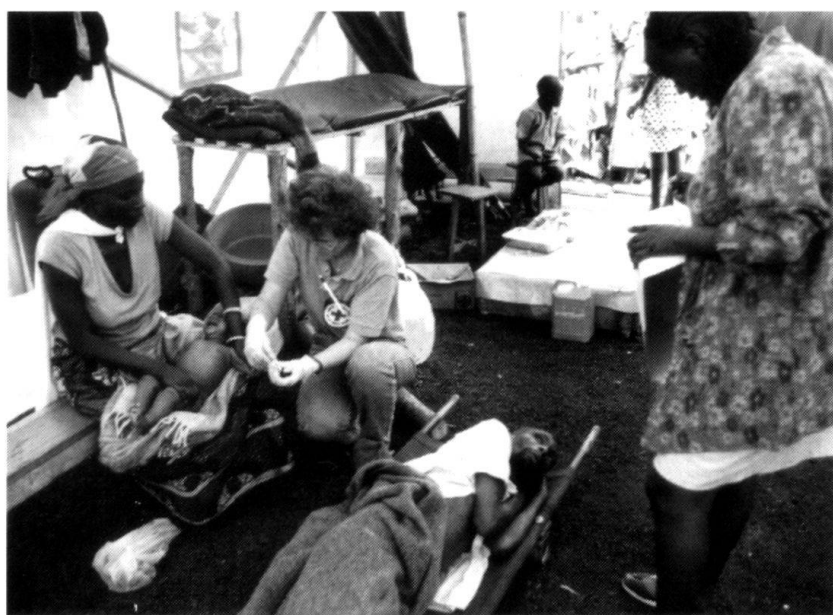
Rwanda 1994: Camp de Nyarushishi, dispensaire.

En Asie, la situation est différente : dans la plupart des Etats, on enregistre un boom économique, en dépit de gouvernements traditionalistes et autoritaires qui prédominent encore largement. Dans de nombreux pays, les tensions politiques ont des revers, désormais bien connus, également au niveau humanitaire : mépris des droits de l'homme, répressions par la force armée, arrestations ordonnées pour des raisons relatives à la sécurité de l'Etat... Nous pensons ici aux personnes détenues pour des raisons de sécurité au Myanmar, en Chine, en Indonésie. Dans d'autres pays, comme l'Afghanistan, le Sri Lanka, le Cambodge, le Tadjikistan, la lut-