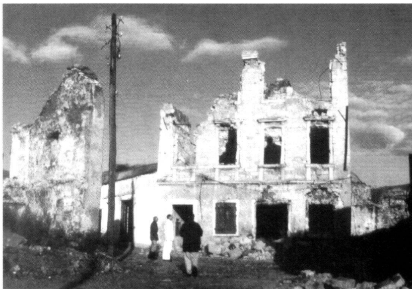
Mostar détruit par les Croates (situation décembre 1994).

Quels sont les retombées de ces guerres pour l'Europe occidentale ? Elles déclenchent des flux migratoires vers l'Europe occidentale, encouragés par des organisations humanitaires qui justifient ainsi leur existence. A long terme, la survie des institutions et des structures sociales des Etats de l'Europe occidentale risque d'être remise en question par de