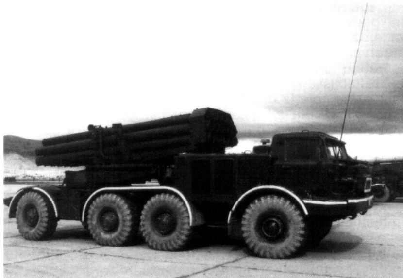
Lance-fusées multiple 220 mm BM-27 (Ouragan). (Armée de Rabbani, Kaboul, avril 1995).

Un autre danger menace à long terme la sécurité, donc la société en Suisse, en Autriche et en Allemagne : les combattants occasionnels dans le contexte de la guerre en Bosnie-Herzégovine. Des ressortissants de diverses factions vivent et travaillent depuis des années dans un pays d'accueil. Ils prennent congé pendant un week-end prolongé, ils profitent éventuellement de leurs vacances, pour se rendre en grou-