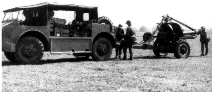
C'est avec l'Armée 62 que l'artillerie tractée cède progressivement sa place aux obusiers blindés, du moins dans les formations de plaine.

Car chacun sait que l'instruction est affaire des