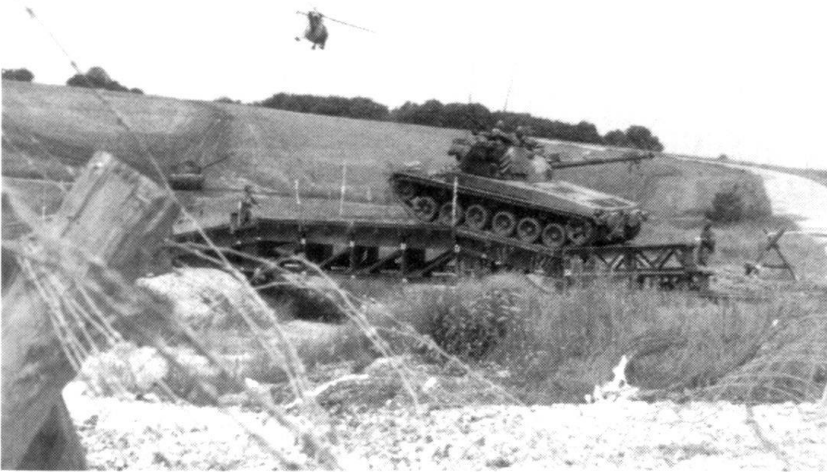
Depuis 1968, les formations blindées disposent de la place d'armes de Bure et des excellentes possibilités qu'elle offre pour entraîner les mouvements dans le terrain.

2005, date prévisible d'une Europe ayant passé du projet à la réalisation.