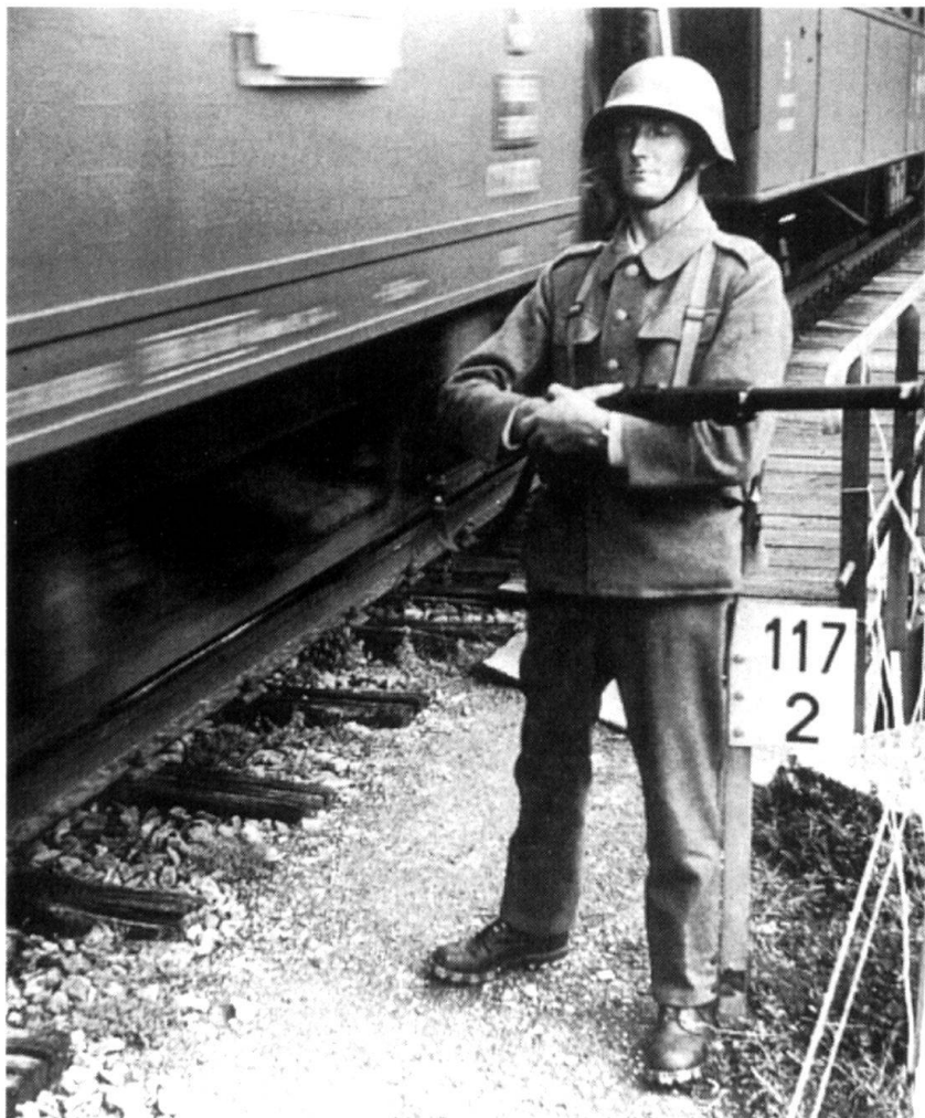
... Et il faudrait engager des troupes pour assumer des missions d'accueil et de garde.

Contrairement aux autres internés, les Soviétiques, à une époque où le communisme fait très peur aux autorités suisses, civiles et militaires, ne bénéficient pas de congés comme les