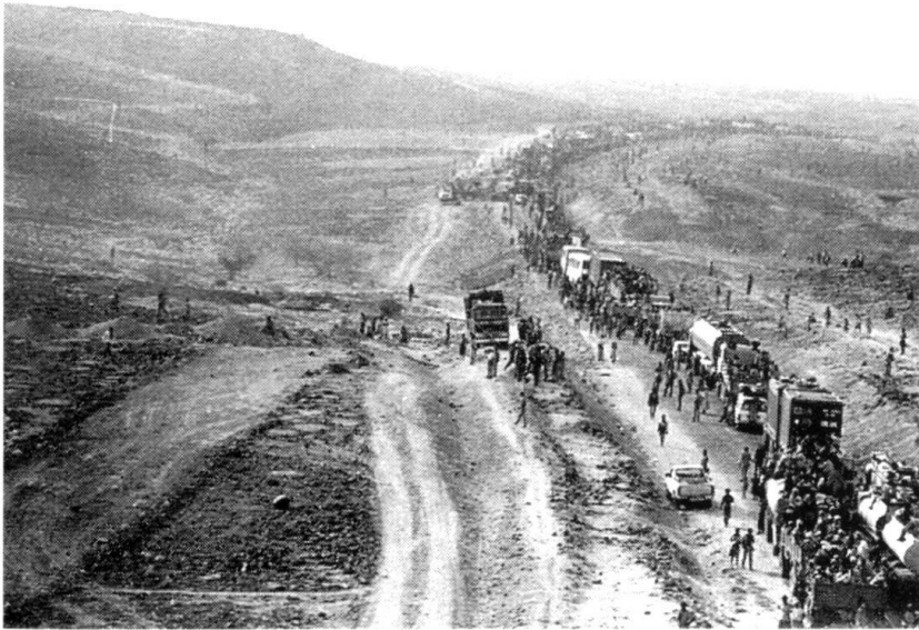
Des lamentables cortèges de réfugiés, tristement familiers dans des paysages somaliens ou irakiens peuvent aussi toucher la Suisse, demain comme naguère pendant la Seconde Guerre mondiale....