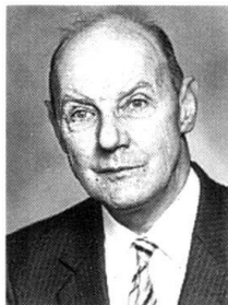
Par François Schaller, professeur honoraire aux univer- sités de Lausanne et Berne

J'ai sous les yeux le dernier numéro du Bulletin Défense . Défendre quoi, et comment? Ces questions, posées depuis toujours, ne cesseront probablement jamais d'animer un débat plus ou moins vif selon les époques et l'environnement politico-militaire. Dire qu'il s'agit de défendre notre pays n'a pas grand sens si on néglige de préciser ce qui chez nous mérite d'être défendu. S'agit-il de protéger nos vertes vallées et ce qui nous reste de glaciers sublimes? Nul ne songe plus à énoncer de telles niaiseries. Nous avons à défendre des valeurs collectives, non partagées, communes à tous les citoyens de notre pays. D'autres Etats les cultivent également pour l'essentiel, mais jamais d'une façon absolument identique. Par bonheur, un régime démocratique est aujourd'hui en vigueur dans toutes les nations européennes; aucune cependant ne le conçoit de la même façon.