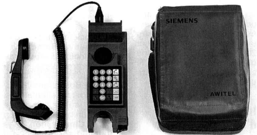
Téléphone de campagne 96 (tf camp 96).

Ce système comprend une paire de lunettes, un appareil de poche et un appareil portatif ; il permet l'exploration et la surveillance nocturne sur de petites distances. L'amplification de la lumière résiduelle, comme la technique bien plus sophistiquée de la vision thermique, n'est pas détectable, puisque purement passive. Elle utilise la lumière qui provient de la lune, des étoiles dans le