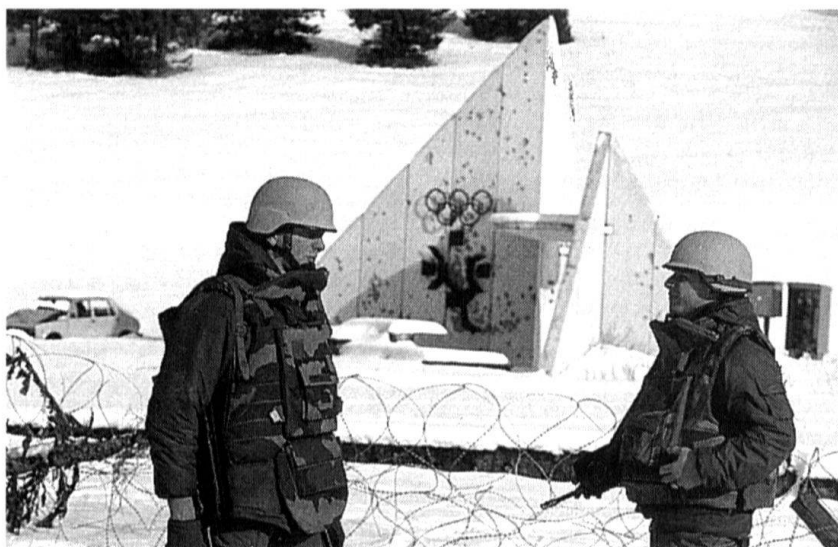
Dans les Balkans en feu.

Ces opérations de l'ONU représentent une large palette d'activités. Elles peuvent, comme au Cambodge, couvrir tous les aspects d'une mission de type gouvernemental ou, comme en Yougoslavie, combiner la surveillance des cessez-le-feu, la garantie de l'acheminement de l'aide humanitaire et l'organisation de négociations. Or l'ONU peine de plus en plus à assumer les coûts de ces opérations de maintien de la paix. Les Etats fournisseurs de troupes, notamment les plus riches, sont appelés à apporter leur propre contribution. La France a estimé l'entretien des Casques bleus, à la charge du ministère de la Défense, à environ 1,3 milliard de francs suisses pour l'année 1993. Le fait que les pays qui mettent des troupes à disposition de l'ONU doivent en plus assurer une partie des coûts occasionnés par celles-ci représente un danger nouveau. De tels contingents n'agissent-ils pas plutôt en fonction des