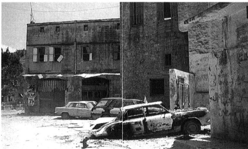
Casques bleus français au Liban (1978).

En mars 1985, l'avènement de Mickhaïl Gorbatchev à la tête de l'Union Soviétique n'a pas fini de surprendre par ses conséquences. Même si le haut dignitaire du Kremlin annonce très tôt ses intentions novatrices, rares sont ceux qui entendent les bouleversements qui vont secouer le monde au cours de la décennie suivante. Les nombreuses étapes du processus d'ouverture permettent le déblocage du Conseil de sécurité, partant un renouveau de l'activité de l'ONU dans le domaine du maintien de la paix et de la sécurité internationales. La crise du Golfe se termine, dans la région, par le rétablissement des frontières reconnues par la communauté internationale, ce qui fait dire à Georges Bush que l'hu-