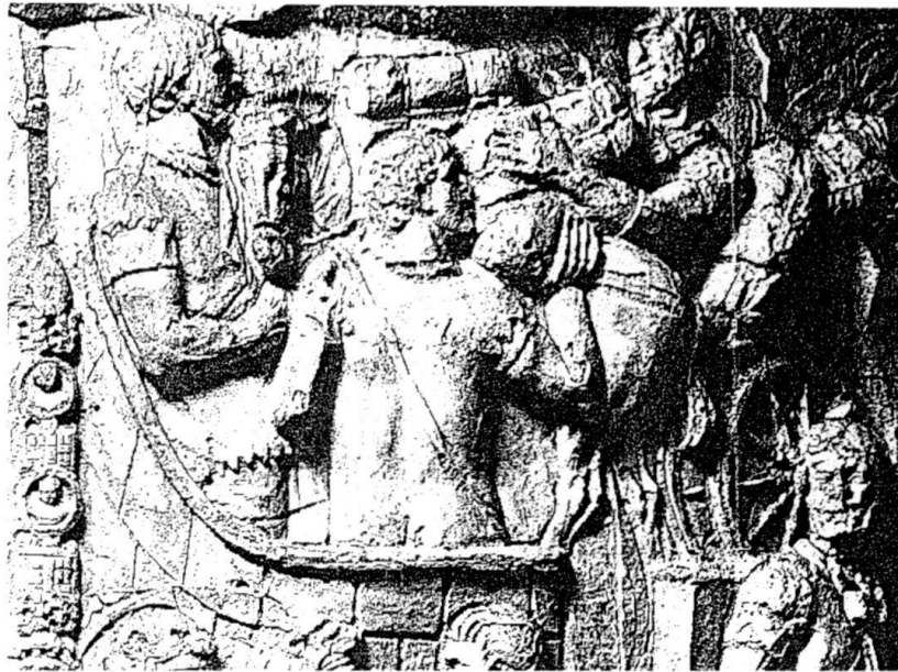
Déchargement pour des légionnaires de chars et de bêtes de somme appartenant au train des bagages et subsistances de leur unité. Détail des colones Trajane à Rome, 107-117 après J.-C.

En territoire non connu ou hostile, on a régulièrement recours aux ressources locales. Les fourrages et les vivres sont exigés par la réquisition, voire par le pillage (bien que ce dernier soit sévèrement puni), soit à titre de soutien pour la campagne de la part des alliés, soit à titre de tribut à