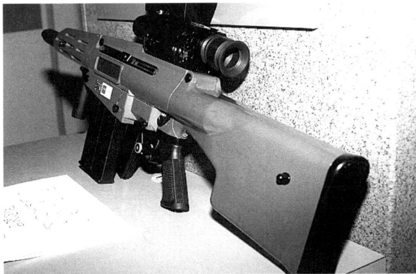
L'OICW d'Alliant Techsystems.

trailleuse légère en 5.56. La mitrailleuse en 7.62 continuera, quant à elle, d'exister, l'armée américaine venant d'acquérir une version modifiée de la FN Mag , en service depuis les années 1970.