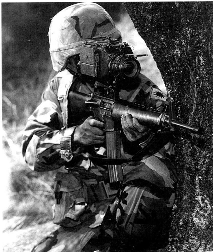
TWS, un viseur léger pour toutes les conditions adverses.

des conditions météo difficiles. Il existe en différentes versions, pour le Stinger , les armes individuelles ou lourdes. Les développements en cours prévoient l'intégration d'un télémètre laser ainsi que d'optiques permettant de voir jusqu'à trois kilomètres. Le poids de ces appareils varie de 1,9 à 3 kilos, selon le modèle. Ils sont déjà prévus pour être reliés à un autre système, comme par exemple le casque du fantassin du futur.