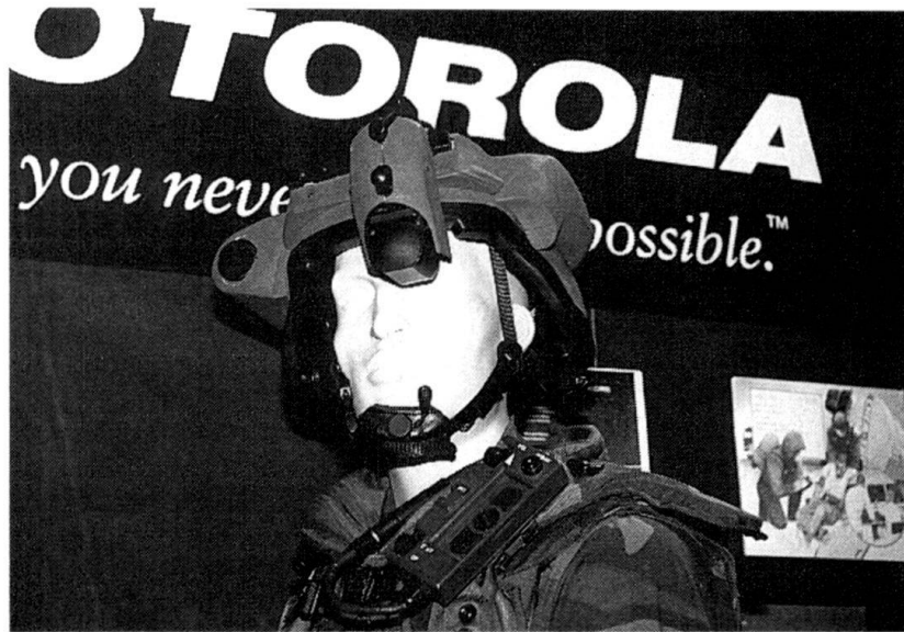
La casque du futur, développé par Motorola.

Le projet de casque est déjà bien avancé. Nous avons pu essayer le produit développé par Motorola prévu pour la production en série début 2000. La caméra vidéo permet la saisie et la transmission d'images en couleur. Son zoom facilite également la recherche de buts. Les informations passent en temps réel à l'utili-