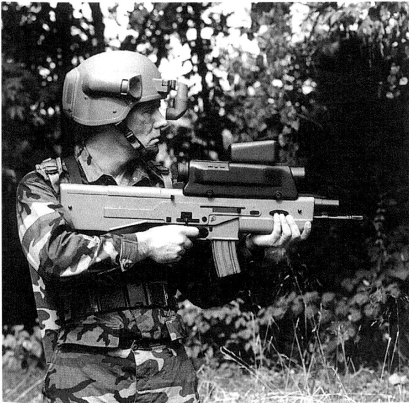
Le projet d'AAI Corporation.

L'OICW est appelée à remplacer l'arme individuelle, le lance-grenade et la mi-