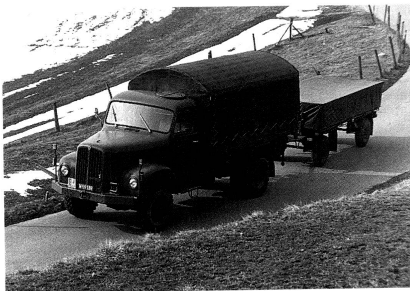
La Division territoriale 1 doit assurer le transport d'importants tonnages.

A la suite du déclenchement d'une mobilisation de guerre ou d'une mobilisation partielle, tout ou parties des installations de soutien sont reprises par les formations de soutien mobilisées ; celles-ci les montent en puissance afin d'être à même de remplir leur mission dans les 48 heures. Elles sont ensuite opérationnelles 24 heures sur 24. En principe, le soutien est conduit selon le principe « Aller chercher » (« Holprinzip »), ce