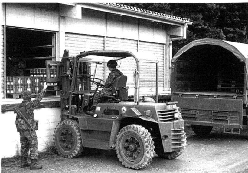
Les troupes de soutien disposent d'entrepôts et de moyens de manutention modernes.