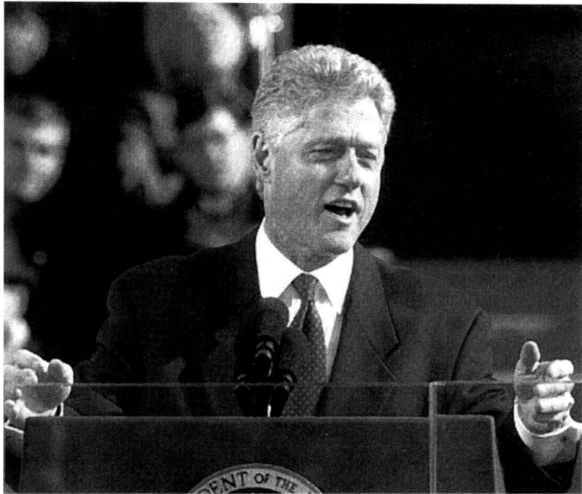
Un pont vers le XXI e siècle : Tels sont les propos de Bill Clinton pour son deuxième mandat à la présidence des Etats-Unis.

C'est la grande surprise de l'automne-hiver 1996-1997 : en congédiant définitivement par les urnes le président Ion Iliescu et sa clique d'ex-apparatchiks communistes agrippés au pouvoir depuis la vraie-fausse révolution de décembre 1989, Bucarest a fait, le 17 novembre 1996, un grand pas dans la bonne direction. Les victoires conjuguées d'Emil Constantinescu à la présidentielle et de sa mouvance chrétien-