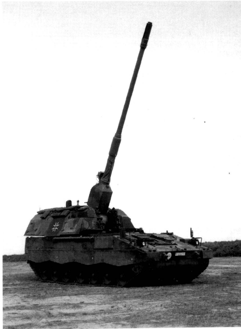
L'artillerie de l'avenir : le PzH 2000 de la firme Wegmann (Photo : Wegmann).

sous le plancher de la tourelle. Le lien avec l'extérieur se fait par une porte et un rail sur lequel sont déposés les obus permettant ainsi à deux hommes de charger, ou de vider, la soute en 12 minutes. Au besoin, les obus passent directement de l'extérieur au bras de chargement.