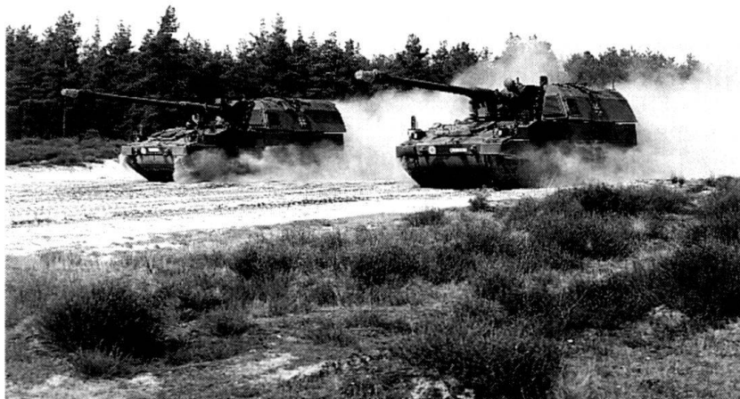
Le PzH 2000 est capable de vitesses supérieures à 60 km/h.

La conduite de tir est signée Daimler-Benz Aerospace AG. MICMOS automatise largement toutes les manipulations et rend compte par l'intermédiaire d'une interface graphique. Un système de navigation inertiel permet en tout temps à l'équipage et au système de connaître les coordonnées de la pièce, ainsi que son altitude et sa direction. Le système peut ainsi fonctionner avec seulement trois hommes. L'ordinateur de bord contrôle la dispersion technique de l'arme et effectue la correction instantanée de la position du tube entre les coups (Koinzidenzprüfung), une fonction qui a permis, lors d'essais en Suède, de démontrer la remarquable précision du tir, y compris sur des buts mobiles.