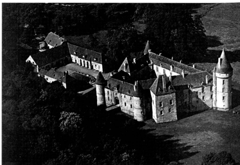
Photographie aérienne du château de Bazoches, demeure de Vauban dès 1675. L'aile allongée est celle de la galerie où travaillaient les ingénieurs. A gauche, le pédiluve et les communs pouvant abriter jusqu'à 60 chevaux, nécessaires aux courriers transportant les plans dans toute la France.

Vauban (1633-1707), Louis XIV (1638-1715), les deux existences se recouvrent, et rarement deux destins auront été liés à ce point. Cadet engagé par Mazarin à l'âge de vingt ans, le futur maréchal de France, com-