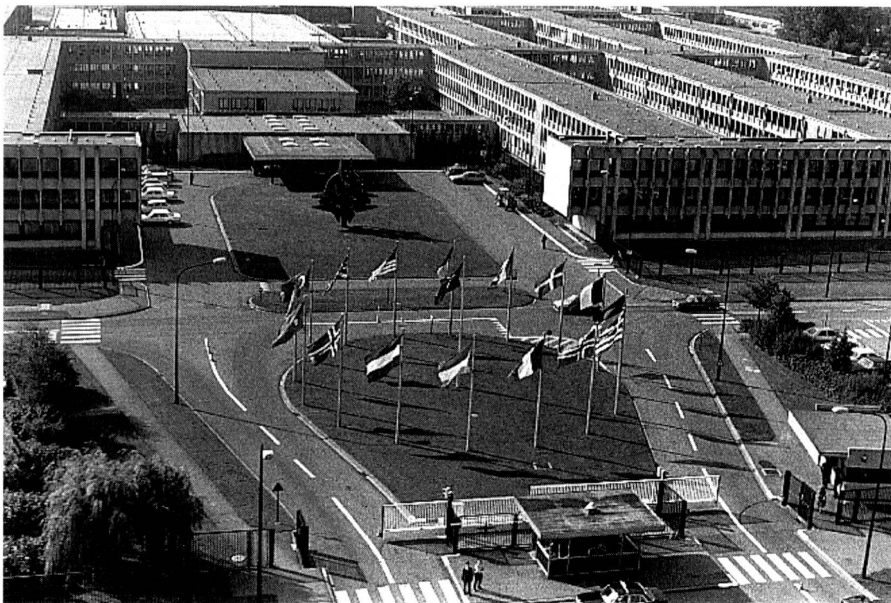
La neutralité, même revue, est-elle compatible avec une adhésion de la Suisse à l'OTAN ?

De plus, pour garantir à long terme ses intérêts spécifiques, l'Europe doit pouvoir compter sur un instrument de dissuasion nucléaire, largement indépendant des structures de l'Organisation atlantique. L'intégration militaire et la force de frappe constituent donc les conditions incontournables de la sécurité continentale. Ces deux conditions sont incompatibles avec la notion de neutralité.