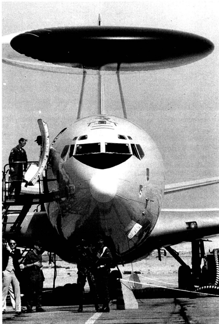
Dans les années qui viennent, la Suisse sera-t-elle amenée à participer à un réseau d'alerte au niveau du continent ? Ici, un AWACS.

tégique. Cette logique est raisonnable, car la sécurité européenne se jouera dorénavant, pour l'essentiel, sur des théâtres extérieurs. Or, aucune nation européenne ne sera jamais plus en mesure de projeter, indépendamment, suffisamment de forces pour défendre les intérêts du continent.