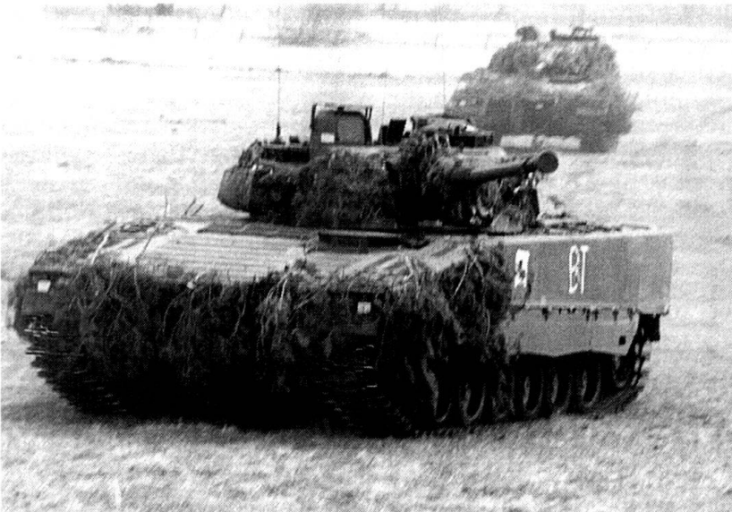
Les chars de grenadiers (ici le CV-90) sont en mesure de suivre les chars et de les appuyer par leur feu.

contre, le char est un élément inégalable : à deux reprises, malgré des pertes initiales élevées, un char seul a détruit une compagnie mécanisée adverse... en moins de dix minutes.