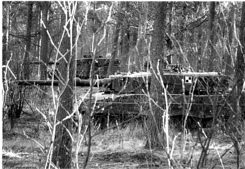
Feu et mouvement : les fauves attendent, observent...

L'entraînement en dehors des phases de combat proprement dites n'est pas négligé : la prise de secteurs d'attente en forêt ou près de zones urbaines, de même que le ravitaillement tactique (par camion-citerne sur une place de ravitaillement ou directement