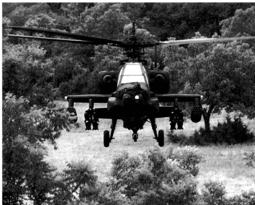
L'hélicoptère Apache AH-64D.

■ Le système Asrad , développé en prévision d'engagements