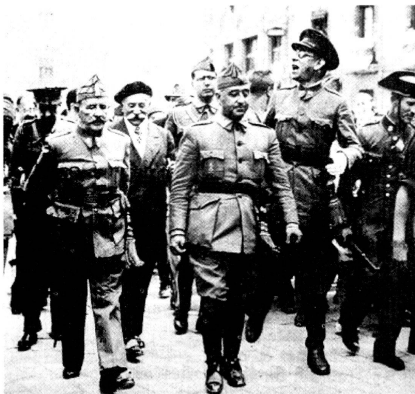
La victoire des nationalistes espagnols provoque l'arrivée en France d'environ 500 000 réfugiés républicains. Le général Franco à Burgos en 1938.

Hors du continent européen, les guerres de l'après-décolonisation, la sécession indo-pakistanaise, les conflits du Proche Orient, du Sud-Est asiatique et ceux d'Afrique noire continuent d'alimenter la vague migratoire. Les réussites, en Europe, dans l'accueil massif de réfugiés