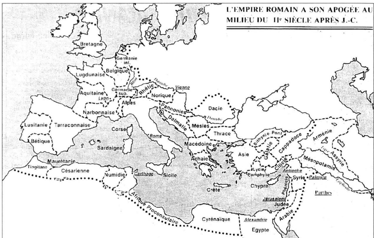
L'EMPIRE ROMAIN A SON APOGÉE AU MILIEU DU I er SIÈCLE APRÈS J.-C.

cie. Les Goths sont intégrés à l'armée et à l'Empire en tant que fédérés (de « foedus », traité). Ils conservent leur culture militaire et leurs chefs. La fiabilité de ces mercenaires immigrés est variable.