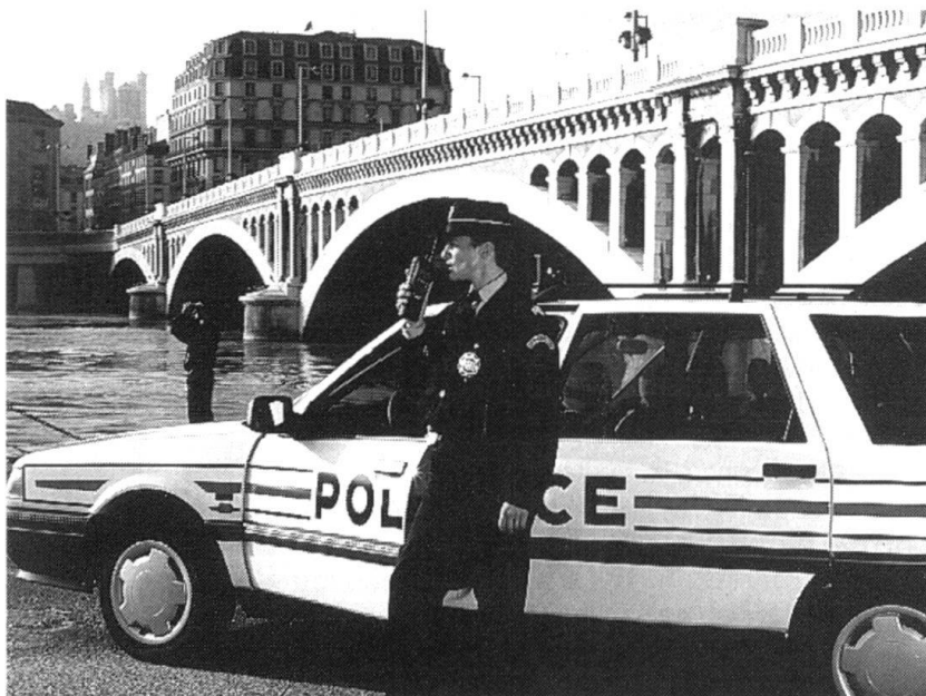
Réseau ACROPOL : utilisation du terminal portatif (Photo: Matra Communication).

Les événements de mai 1968 montrent que l'équi-