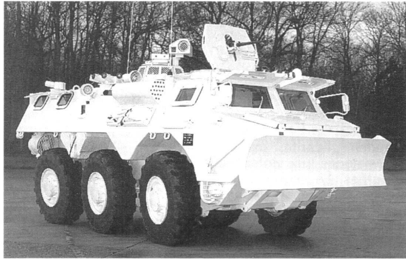
Galix : système de défense pour le maintien de l'ordre.

Le commandement devient de plus en plus centralisé, les décideurs ne se trouvant plus immergés dans le feu de l'action. Les hommes des forces de l'ordre ne parlent jamais aux manifestants. Ce faisant, ils donnerait à penser qu'ils prennent fait et cause pour les contestataires. L'intimidation présuppose une organisation, dont l'invisibilité de la mise en place du barrage. Dès la descente des véhicules, l'uniformité des gestes commence. Il