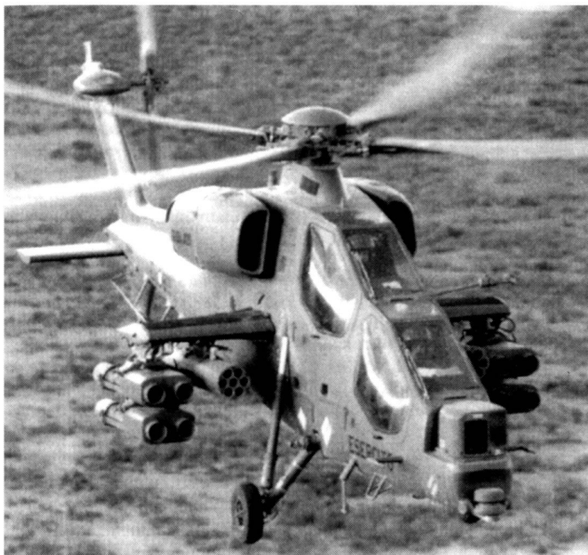
A-29 Mangusta. L'armée italienne en a une soixantaine.

sont dépassées. Cet engagement s'apparente à notre conception suisse. Ces derniers temps, l'armée de terre a participé à l'hébergement des réfugiés albanais, des sinistrés après les tremblements de terre de la région de l'Ombrie.