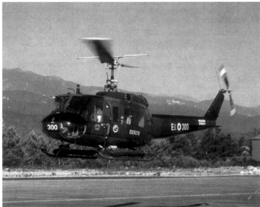
Hélicoptère terrestre Agusta-Bell AB 205.

Elles sont organisées en deux groupes pour remplir des mis-