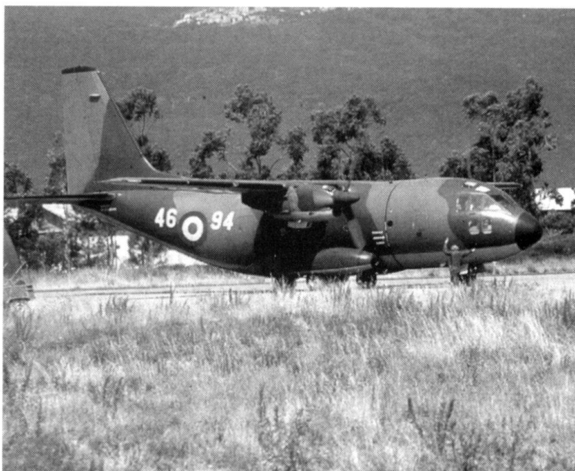
Appareil de transport et de liaison Aeritalia (Fiat) G-222.

Avec ce nouveau modèle de défense, l'Italie va au-delà d'une simple réarticulation de ses moyens, puisqu'il s'agit en fait d'une refonte du système de recrutement, donc du facteur « Aptitude individuelle » de tous les maillons et d'une optimisation de la chaîne de commandement intégrée. Le but essentiel, c'est celui de configurer l'instrument militaire en fonction des nouveaux