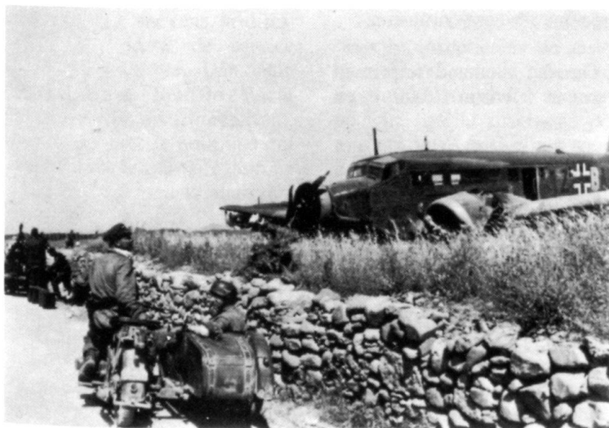
Deux motocyclistes allemands devant un Ju-52 qui s'est écrasé dans un champ près de Malène.

La retraite alliée, à travers le massif central en direction du port de Sphakia sur la côte Sud, prend la dimension d'une déroute. Les Grecs continuent le combat avec acharnement dans le secteur d'Alikianou, si bien que seules de faibles forces allemandes sont engagées dans la poursuite. Des héros couvrent cette retraite, se sacrifiant pour que d'autres puissent embarquer et quitter l'île. Des partisans mènent des actions dans les zones de montagne; des paysans vont payer un lourd tribut. Le plus célèbre résistant néo-zélandais, connu sous le nom de capitaine Vassilios, ne sera abattu qu'en 1944, après avoir tué de sa main plus de