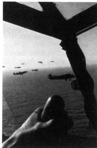
Vu d'un planeur: les Ju-52 survolent la mer Egée, vers la Crète.

100 Allemands. Sa tombe est encore honorée actuellement.