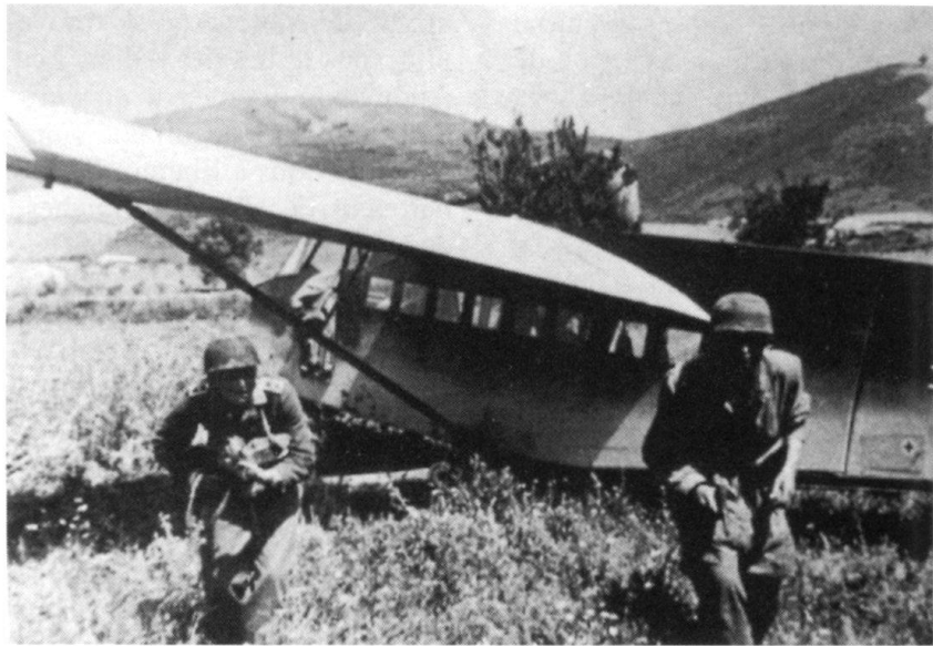
L'arme au poing, des soldats allemands très résolus s'écartent de leur planeur endommagé.

Du côté allié, le général Freyberg ne commande pas depuis l'avant comme Rommel. Aussi le dialogue entre le général Puttick, commandant de la 5 e brigade, et le commandant en chef est toujours dépassé par les événements. Tous deux pensent trop à la retraite et ne croient pas pouvoir gagner une bataille sans disposer de la supériorité aérienne. Ils sous-estiment la valeur de leurs soldats.