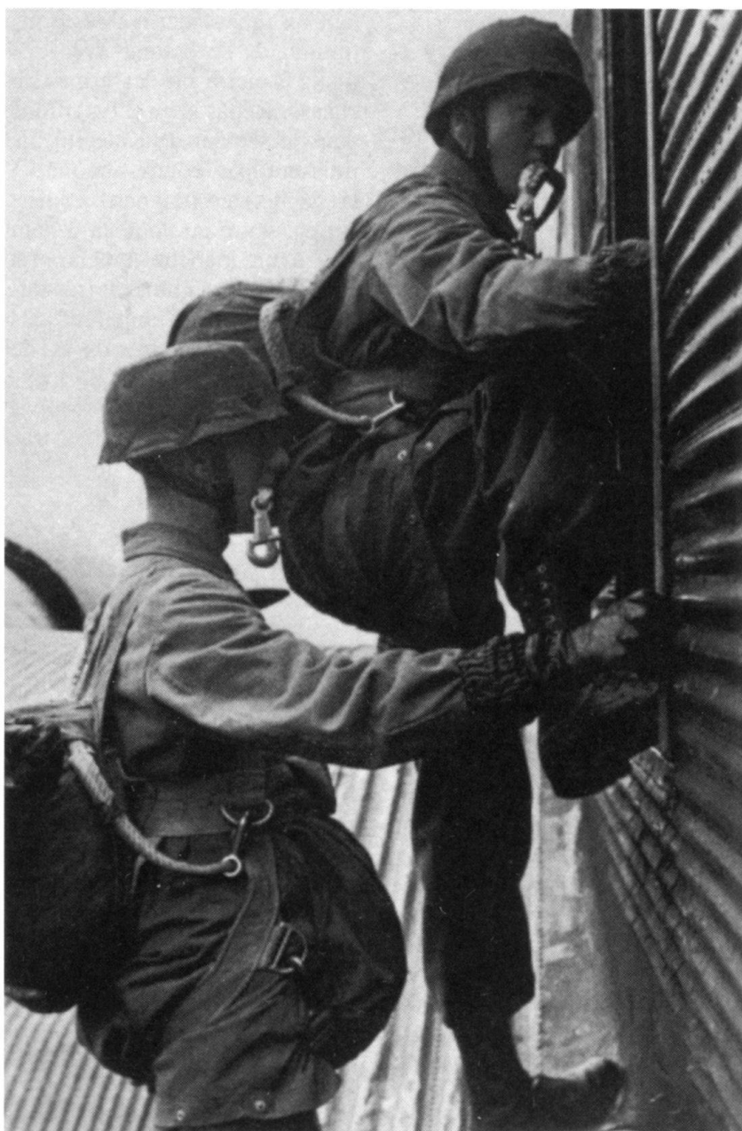
Corde de déclenchement aux dents, des paras montent dans un Ju-52.