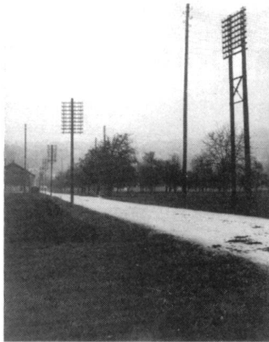
D'interminables rangées de poteaux témoignent du développement du télégraphe et du téléphone.

Bâle peut construire un émetteur dans l'enceinte de son aérodrome et inaugure Radio Bâle le 19 juin 1926, grâce à l'appui des autorités militaires, conscientes qu'elles pourront difficilement en tirer parti à des fins militaires, vu la situation du site à la frontière. En été 1924, elles recommandent pourtant au Conseil fédéral de soutenir la construction d'une station radio à Bâle, comme cela a été fait à Lausanne et à Genève, cela afin d'assurer le maintien de l'ordre, en cas de troubles politiques. L'émetteur national de Monte Ceneri, inauguré en octobre 1933, se trouve dans une zone fortifiée, d'où son surnom au Tessin de «transmittitore inaccessibile»!