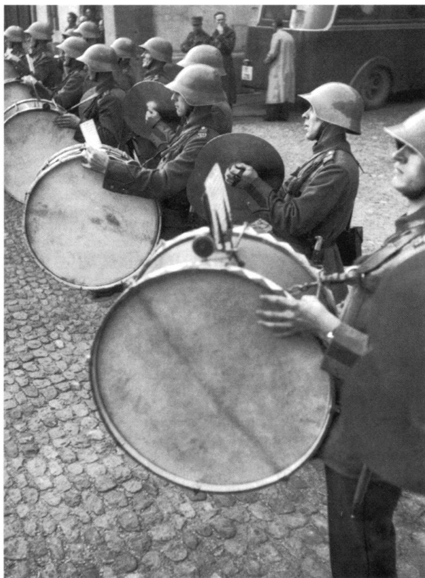
Journée de la musique militaire, Bâle, 23 novembre 1940. Au début de la guerre, l'armée suisse utilise les marches militaires allemandes. Pour remédier à cette situation devenue inopportune, la radio organise à travers la Suisse un concours de composition de marches militaires.