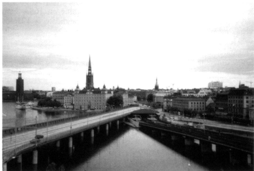
Des Etats socialement avancés comme la Suède n'ont pas avantage à s'aligner sur les normes européennes. Ici une vue de Stockholm, la ville qui vit en symbiose avec la mer...

Toutefois, il y a un autre prix à payer, beaucoup plus lourd de conséquences. Les Etats-Unis ne voient plus l'Europe comme une sonnette d'alarme face à un éventuel agresseur soviétique. C'est pratiquement son plus grand compétiteur économique, donc virtuellement un adversaire. L'intérêt américain commande de rabaisser ce compétiteur. Comment trans-