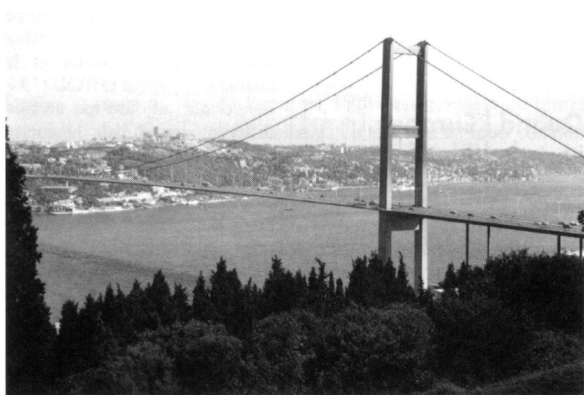
La Turquie sera-t-elle admise dans l'Union européenne? Ses 66 millions d'habitants en font un Etat aussi peuplé que la France. Dans cinquante ans, la Turquie pourrait avoir 100 millions d'habitants... Ici le pont, près d'Istanbul, qui unit l'Europe à l'Asie.

former l'Europe en un marché ouvert de 370 millions de consommateurs et la faire sortir de la technicité? L'élargissement est un moyen, car les pays les plus riches de l'Union européenne en perdraient la direction politique et épuiserait leurs ressources à intégrer des pays plus pauvres. Les nouveaux membres se verraient ouvrir les portes de l'Europe occidentale, avec une immigration d'autant plus massive qu'incontrôlée.