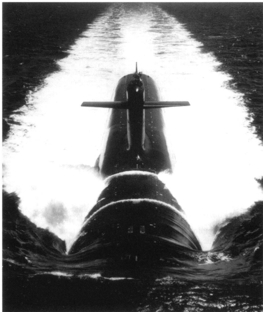
Sous-marin nucléaire lanceur d'engins, le Triomphant.

Le génie génétique offre à la guerre bactériologique, non seulement une vaste gamme d'agents pathogènes, mais des