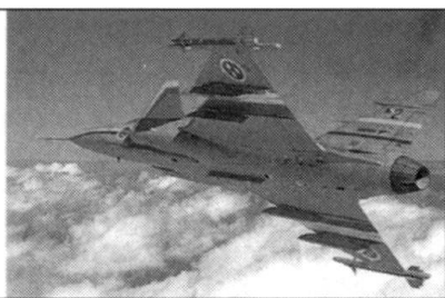
JAS 39 Gripen.

possibilités effrayantes, comme l'inclusion de la dimension temporelle dans l'action de l'agent: la stérilisation progressive, sur plusieurs générations, d'un groupe ethnique ciblé 12 .