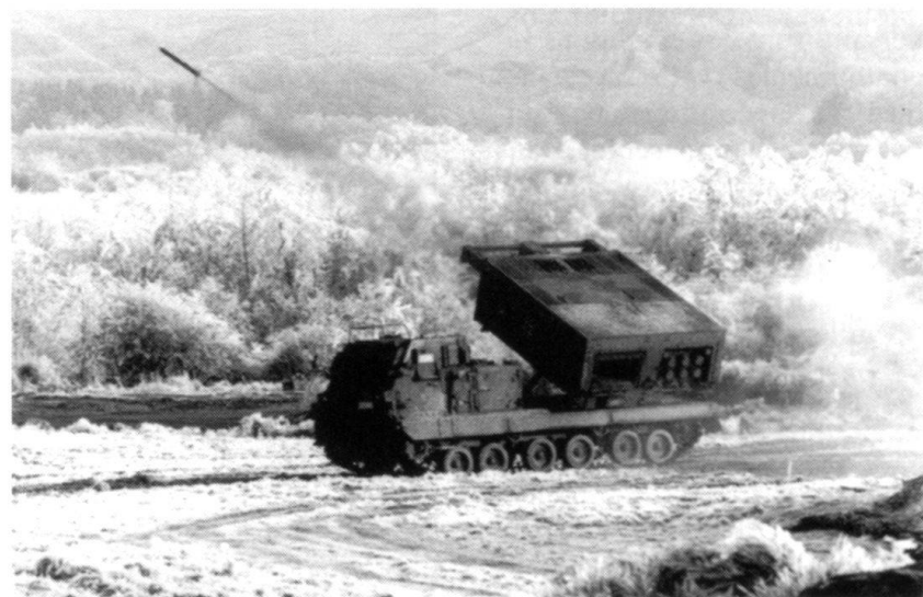
Le lance-fusées multiples est essentiel dans le combat par le feu dans la profondeur.

Les opérations dans les secteurs arrières assurent une protection et garantissent la liberté opérative dans les autres par-