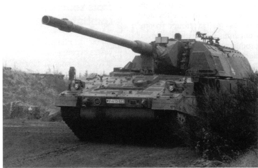
Le Panzerhaubitze 2000 de 155 mm assure l'appui de feu pour les opérations immédiates. Il se caractérise par une grande précision et une grande portée pratique.

■ Le combat, qui se jouera dans des situations de duel, ne se terminera par un succès que si l'on empêche l'adversaire de se présenter dans un état de préparation adapté à la situation. C'est pourquoi on doit disposer d'une importante capacité de détruire les forces ennemies dans la profondeur du secteur, si l'on veut créer un rapport des forces aussi favorable que possible. Dans la foule, l'adversaire ne peut pas réaliser ses plans: il se trouve obligé de réagir. L'initiative lui échappe; dans le meilleur des cas, la décision tombe, avant que le commencement de la phase «Duel».