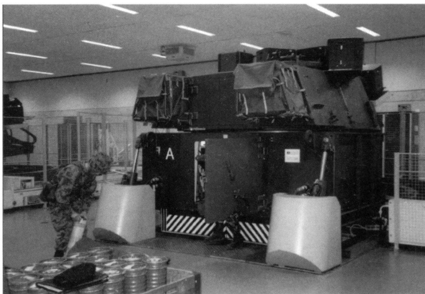
Une tourelle SAPH...

Le simulateur permet d'exercer des engagements d'obusiers blindés M-109 , comme en situation de guerre, mais sans tir réel. C'est un moyen de donner aux cadres et aux hommes de bonnes chances de remplir leur mission en cas d'engagement réel, de les rendre capables, grâce à la technique de combat et à la tactique d'utiliser toutes les possibilités de leur système d'arme.