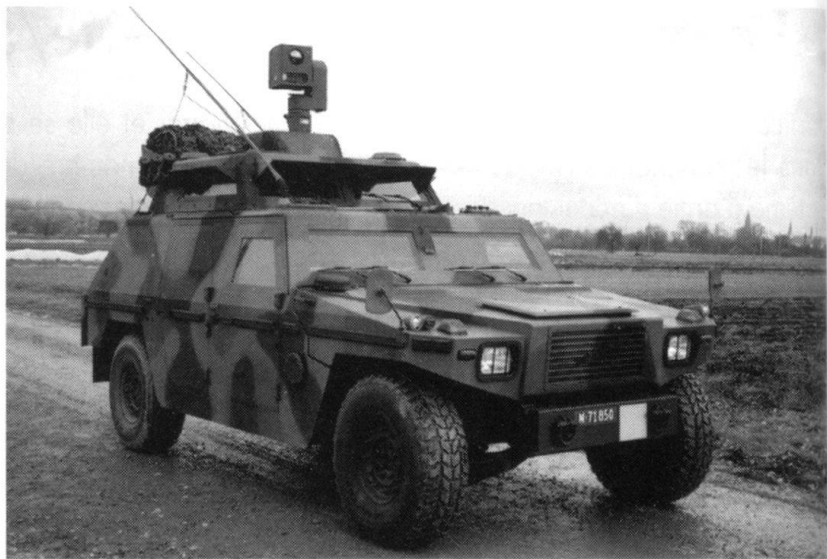
Véhicule commandant de tir.

Le système de navigation militaire MILNAV , le système de navigation de l' Obusier blindé M-109 KAWEST , le GPS en cours d'introduction