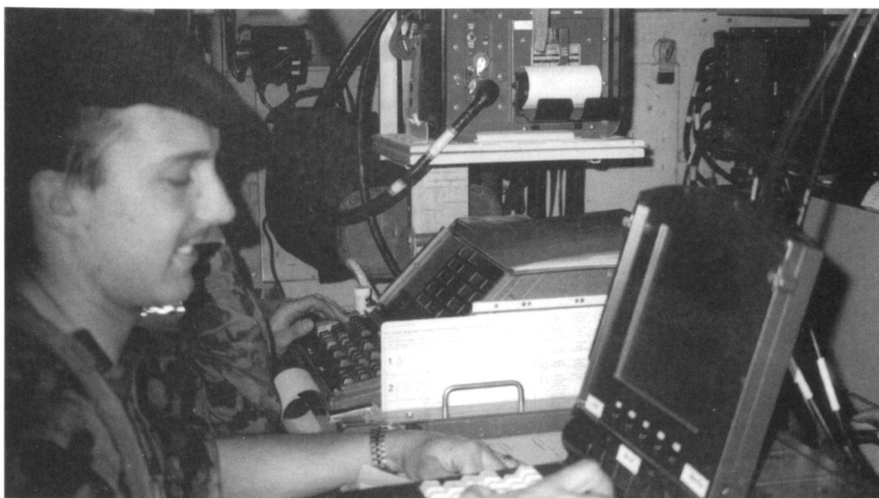
INTAFF : Poste de commandement de tir dans un M-113 de commandement.