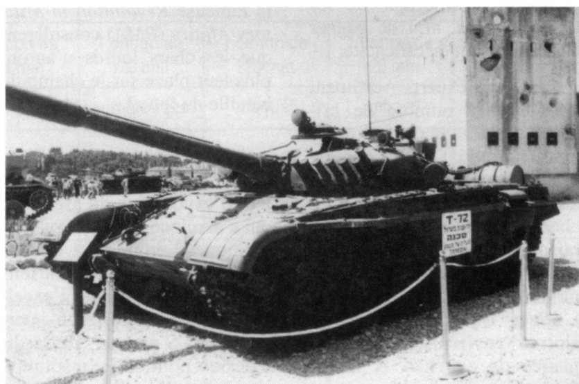
Le principal adversaire du Merkava, le T-72.

Actuellement, Tsahal met en œuvre près de 1200 Merkava