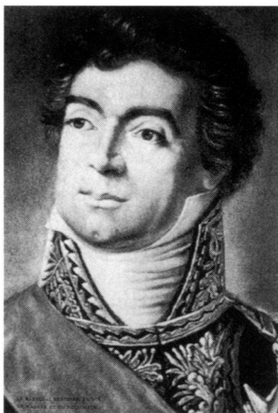
Le maréchal Berthier, inquiet du génie de Jomini.