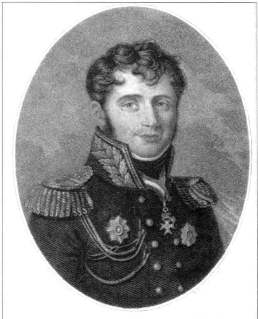
«Monsieur le Suisse», général de brigade au service de Napoléon I er

Lors de la bataille de Iéna, Jomini charge, sabre au clair, avec le maréchal Ney à qui il apporte les ordres de l'empereur. Inquiet, ce dernier le voit revenir avec plaisir, le lendemain, et lui pardonne son abandon forcé. Ne s'agit-il pas, maintenant, d'entrer à Berlin ? Jomini prévoit le passage de l'Elbe à Wittenberg et à Dessau, ce qui se produit le 27 octobre 1806. La Prusse est effondrée. Il ne reste, sur le continent, plus que la Russie à