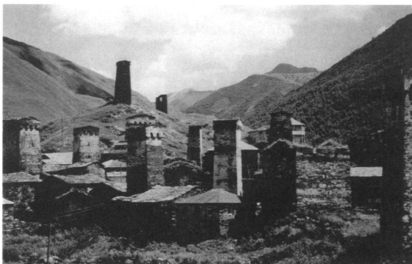
La Svanétie, région montagneuse située au Nord-Ouest de la Géorgie, à proximité de l'Abkhazie et de la Russie.

Autre concurrent sérieux: le Royaume-Uni. L'intérêt de celui-ci pour la Transcaucasie remonte à la fin du XVIII e siècle, au moment où la Couronne britannique s'emparait des Indes, alors même que la Géorgie se tournait vers la Russie. Dès lors, la Transcaucasie fit partie intégrante du «Grand Jeu» auquel se livrèrent Britanniques et Russes pour le contrôle ou la neutralisation de cette région. Dès la fin de la guerre froide, Londres fut l'une des premières capitales à renouer avec Tbilissi et à mettre en place une coopération significative. Rappelons simplement deux faits: British Petroleum est la société occidentale qui investit le plus dans le projet d'oléoduc Bakou - Ceyhan et la société anglo-géorgienne Canargo vient de découvrir un gisement pétrolifère prometteur dans la région de Ninotsminda. Pour le Royaume-Uni, la Géorgie constitue à la fois un point d'encrage dans le Caucase et un enjeu économique potentiellement important. Londres n'en conserve pas moins un profil beau-