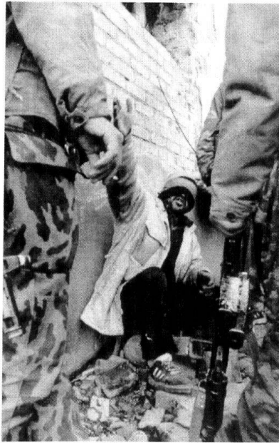
Capture d'un Tchétchène en 1999. (Truppendienst 6/2000).

Les principaux modes d'action des rebelles sont l'attentat contre les troupes en uniforme, généralement à l'aide de mines commandées à distance et fabriquées à partir d'obus et de bombes non explosées, ainsi que l'assassinat à l'arme automatique. La motivation des combattants est accrue par un système de primes : un avion russe détruit vaut 10000 dollars, un hélicoptère 4000, un officier tué ou capturé 1000 ; chaque mine posée permet de recevoir 400 dollars. Les rebelles soignent les contacts avec la population, dans laquelle ils se fondent pour prendre du repos, collecter des vivres ou échanger des informations.