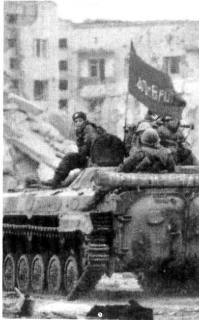
Transport de troupe russe à Grosny en 1999.

Depuis l'automne dernier, l'Etat russe tente de procéder à une «tchéchéenisation» du conflit, c'est-à-dire de remplacer ses troupes et ses fonctionnaires par des acteurs locaux. Afin de limiter l'impact de ses pertes sur l'opinion publique, le commandement interarmées a remplacé de nombreux conscrits par des soldats sous contrat. Mais l'engagement de troupes motivées avant tout par l'appât du gain a augmenté les pillages incontrôlés et aggravé la corruption, alors que la nomination de fonctionnaires tchéché-