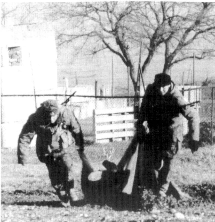
En 1999, les forces russes furent battues par la guérilla tchétchène en combat rapproché. Ici, évacuation d'un blessé (Truppendienst 6/2000).

Malgré les méthodes que pratiquent les Forces fédérales, les combattants tchétchènes