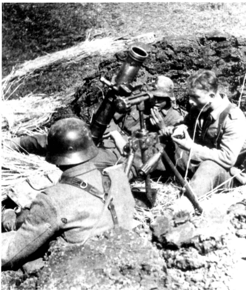
Des soldats allemands de la Seconde Guerre mondiale portant un casque typique: ils engagent un Minenwerfer...

L'infanterie passe de 67% à 45% des effectifs, mais subit le 88% des pertes totales. L'expression «chair à canon» prend tout son sens. Le combat d'infanterie s'apparente à la guerre de siège telle que la préconisait Vauban: avec les tranchées s'ouvrent mines et contre-mines. Dans les tranchées, la tête devient la partie la plus exposée. Les Français adoptent la bourguignotte d'acier (1916) et les Allemands, après en avoir coupé la pointe, remplacent leur casque de cuir par le Stalhelm , ancêtre du modèle 1939-1945 et du casque américain Fritz en usage depuis les années 1980. Des masques blindés pour guetteurs, des armures de tranchées apparaissent. Les masques à