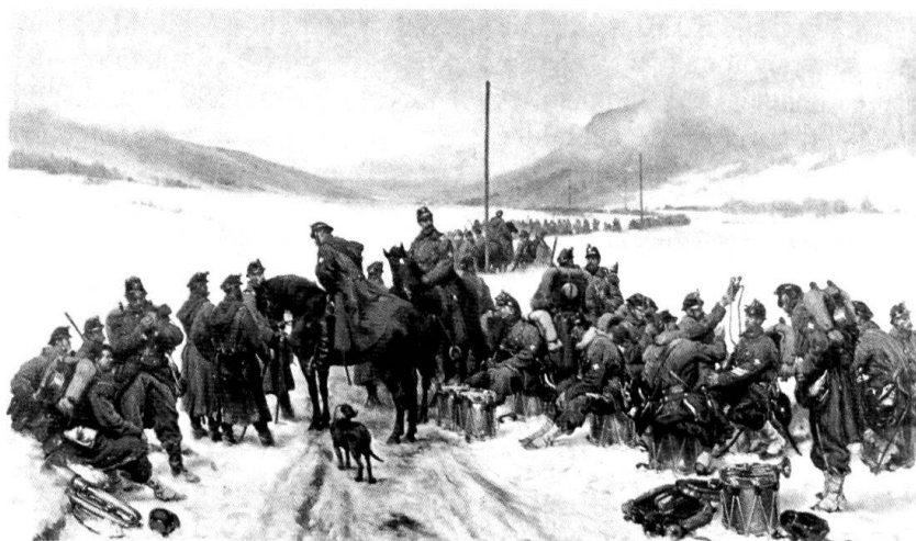
Les troupes suisses aux Verrières en 1871 ne portait pas de casque, mais le shako. Elles internent l'armée Bourbaki.

En 1884, le baron von der Goltz estime la portée efficace d'un fusil à 1000 mètres, d'un canon à 2000-3000 mètres. Selon lui, l'arme à feu cause des pertes, la baïonnette augmente l'impression de terreur et achève la défaite psychologique de l'ennemi. Toutefois, il reconnaît la primauté du feu et dé-