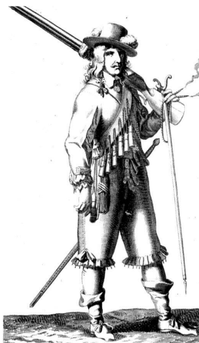
Un soldat de la guerre de Trente Ans.

Le feu d'artillerie, qui provoque alors 40-50% des pertes, l'emporte sur le feu de mousqueterie (30-40% des pertes). La tactique offensive qui associe tirailleurs et colonnes convient parfaitement à la guerre de masse, avec des recrues moins formées que les professionnels automatisés de l'ancien régime. Elle a l'avantage d'être « tout-terrain ». Le choc et le fer retrouvent un rôle perdu au XVIII e siècle. Le combat