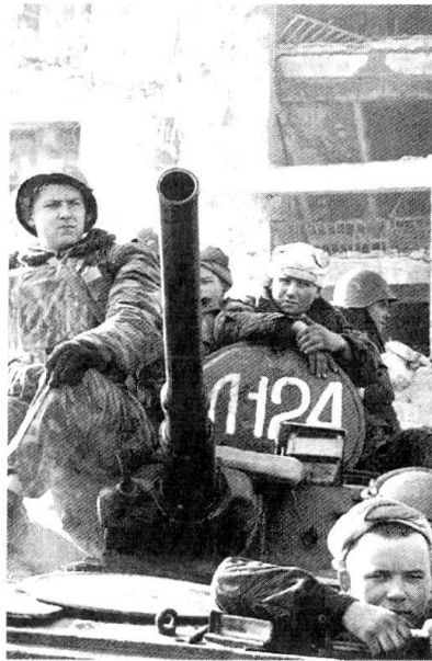
Des soldats russes à Grosny. Le Gouvernement russe justifie ses opérations en Tchétchénie par une volonté d'y extirper des réseaux terroristes. Difficile pour les responsables américains de les blâmer...

L'attaque contre New York et Washington comportait des éléments nouveaux que l'on avait forcément beaucoup de peine à imaginer. Jusqu'au 11 septem-