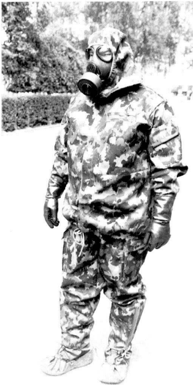
Depuis les attaques à l'anthrax aux Etats-Unis, on prend beaucoup plus au sérieux la protection NBC (nucléaire, bactériologique, chimique). Ici la tenue NBC de l'armée suisse.

tentative en 1993 avec des bacilles d'anthrax avec un résultat aussi «décevant». Les dispositifs de dispersion n'étaient pas efficaces. Heureusement que les terroristes ne maîtrisaient pas cette technique! Dans le second semestre de 1999, la CIA cherchait si le virus, proche de celui du Nil occidental, soupçonné d'avoir tué 4 personnes et infecté 33 autres dans la région de New York, provenait d'un acte de terrorisme. Selon les experts, Saddam Hussein a fait développer le virus du Nil occidental comme arme biolo-