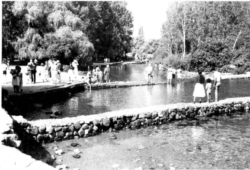
Vue des sources du Jourdain. (Photo prise en 1984).

Désormais, les seules revendications sionistes sur l'eau, qui restent insatisfaites, portent sur le Litani, toujours sous souveraineté libanaise. Déstabilisé par la question palestinienne et les divergences profondes qu'elle suscite à l'intérieur, le Liban plonge dans la guerre civile en avril 1975, après de multiples incidents entre phalangistes chrétiens et combattants palestiniens. Un an après, la Syrie intervient dans le conflit. Pour Damas, il s'agit d'empêcher les Palestiniens de prendre le contrôle du Liban et d'interrompre la montée en puissance des Sunnites. Pour Israël, la guerre civile libanaise est une aubaine qui pourrait permettre de s'emparer des réserves en eau du bassin du Litani, de recomposer le Liban, voire la Syrie, suivant un schéma communautaire et de créer