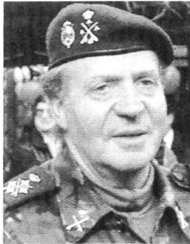
Le roi Juan Carlos I er , commandant en chef des forces armées.

Les sociétés s'organisent et se structurent pour atteindre certains objectifs dont la réalisation bénéficie à l'ensemble de ses membres. Les unes se distinguent par le fait que leurs citoyens se rassemblent autour de certaines valeurs et de certains principes qui constituent leurs marques d'identité et qui, avec leur histoire et leurs traditions, forment leur culture propre, en l'occurrence la culture d'une nation. Dans la mesure où ces sociétés ont réalisé et consolidé des objectifs qui constituent leur raison d'être, leur désir et leur détermination de les protéger contre les risques qui peuvent se présenter ont également augmenté. Les forces armées sont l'outil qui garantit la défense ultime, en cas de besoin, de ces intérêts généraux.