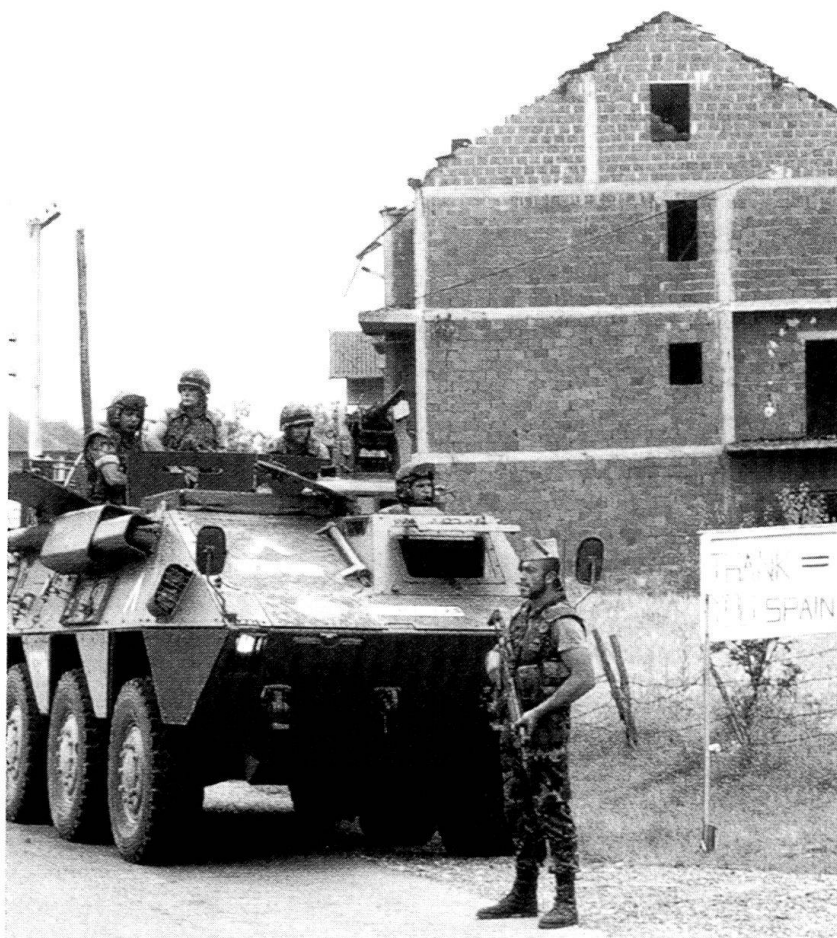
Soldats espagnols déployés au Kosovo.

Souvent, cette assertion est perçue comme une «belle chanson» qui peut être fredonnée en toutes circonstances. Cependant, aujourd'hui comme hier et, certainement demain, c'est une affirmation qui reste vraie. La suppression du service militaire obligatoire et la disparition des menaces traditionnelles dérivées de la guerre froide, qui mettaient en danger la survie même des pays et de leurs populations respectives, ne réduisent pas la nécessité de la participation de tous les citoyens à cette tâche. Et leur contribution à la défense ne se limite pas au service militaire: