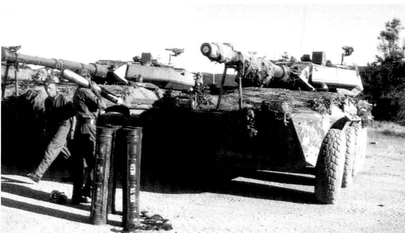
Des cavaliers du 2 e régiment Piemonte Cavalleria complètent la dotation en munitions de 105 mm de leurs Centauro, un engin blindé puissamment armé et doté d'une excellente mobilité.

■ sous condition de réussite au concours d'entrée, l'arme des Carabiniers réserve 1200 postes par an aux anciens engagés; la Garde des finances pourrait offrir dans les mêmes conditions jusqu'à 500 postes par an;