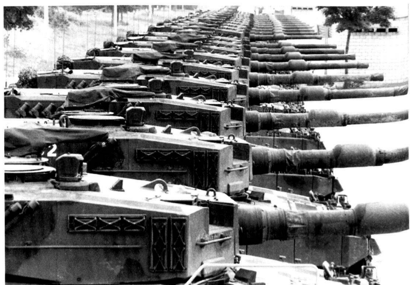
... et l'on réduit le contenu des arsenaux et des parcs.

En second lieu, d'estimer le temps nécessaire à la mise sur pied du personnel militaire ainsi que du temps destiné à son instruction.