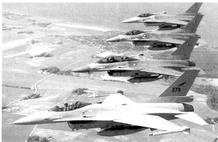
Les F-16 sont l'un des fleurons de la flotte européenne.

qu'il ne faut jamais descendre au niveau de la guerre de l'ennemi (niveau industriel). Le second, celui de l'intensité, voit dans la guerre de l'information une guerre qui ne doit connaître aucune limitation dans la montée aux extrêmes.