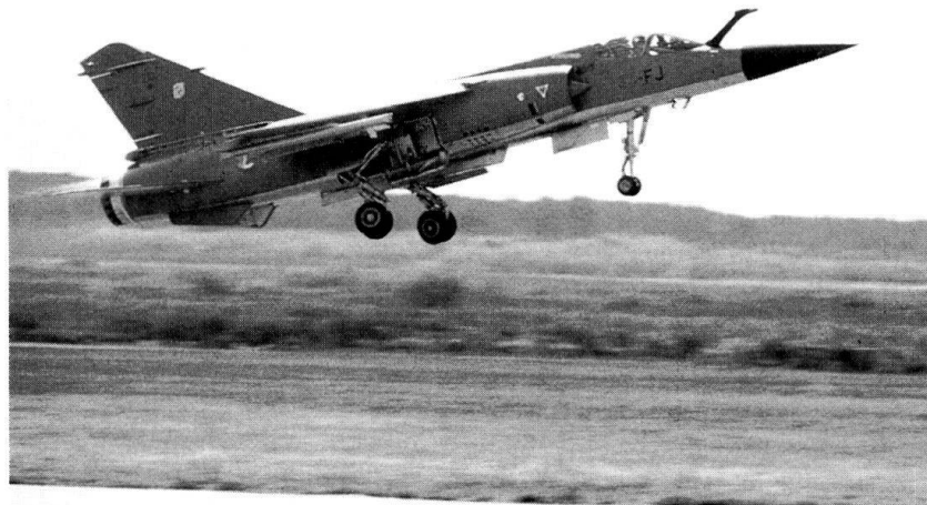
Le Mirage 2000D fait partie des avions engagés.

que les forces aériennes représenterait une option qui limiterait fortement le choix des chefs militaires dans leur quête de la victoire. Il fait remarquer que deux types d'armes peuvent interférer et bloquer le processus d'acquisition de la supériorité aérienne: ce sont les avions et les systèmes sol-air. L'infrastructure qui soutient ces systèmes d'armes ne doit pas être négligée, car elle est essentielle au bon fonctionnement de ces derniers. Elle comprend les systèmes de détection et de contre-mesures électroniques, les bureaux d'études ou d'ingénieurs qui élaborent les futurs systèmes d'armes, les munitions et le carburant des avions.