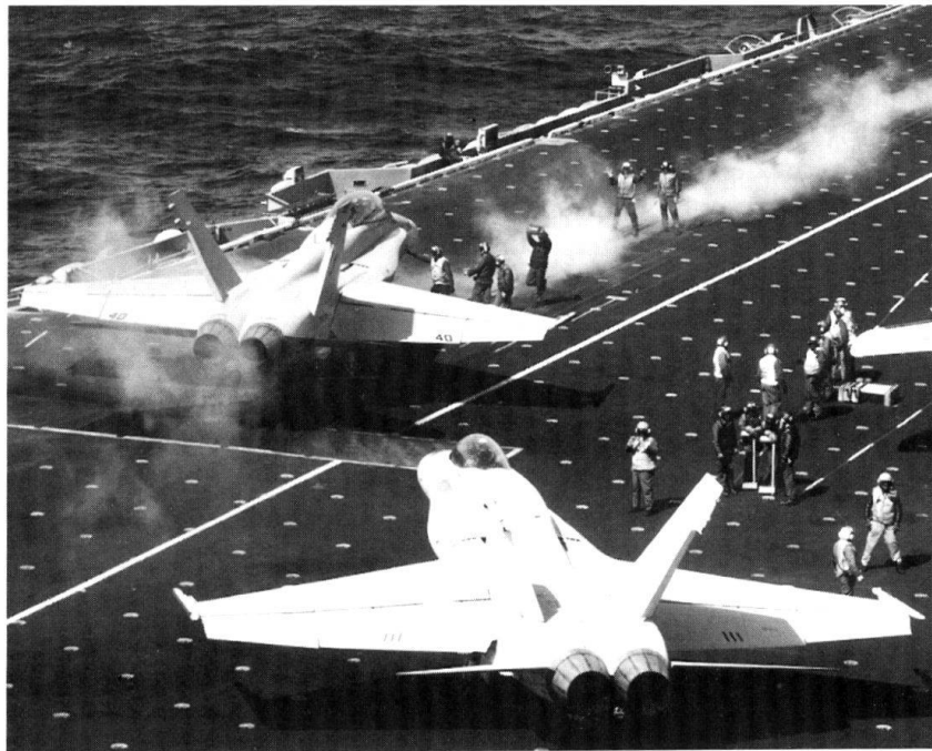
Des F/A-18 en action sur un porte-avions de l'US Navy.

La destruction des missiles Scud par des attaques aériennes s'avère également un semi-