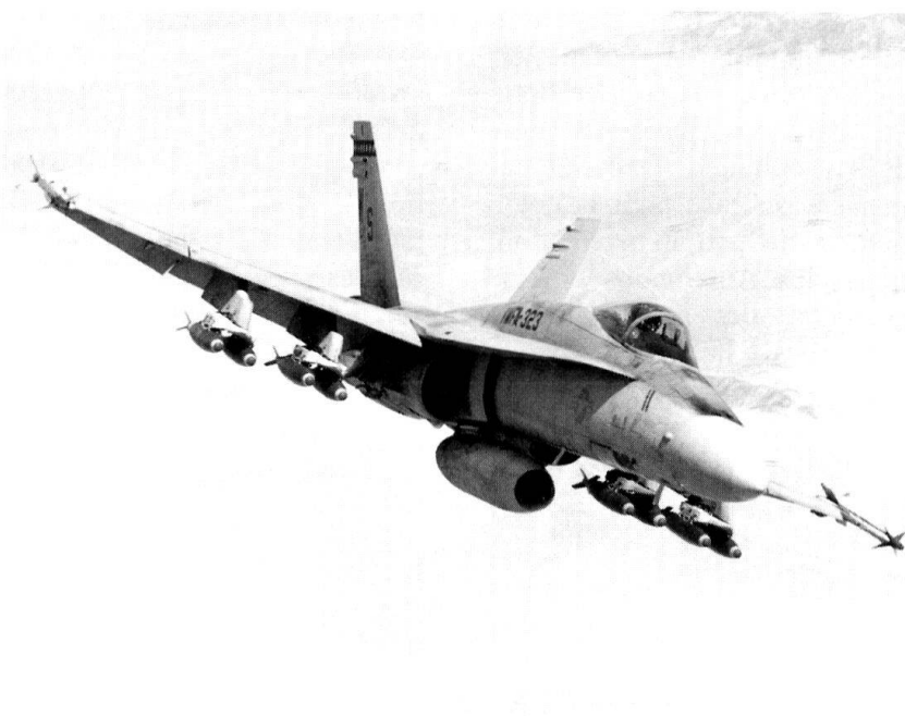
Un F/A-18 survolant le désert de l'Irak.

Quant aux installations de surface, leur destruction re-