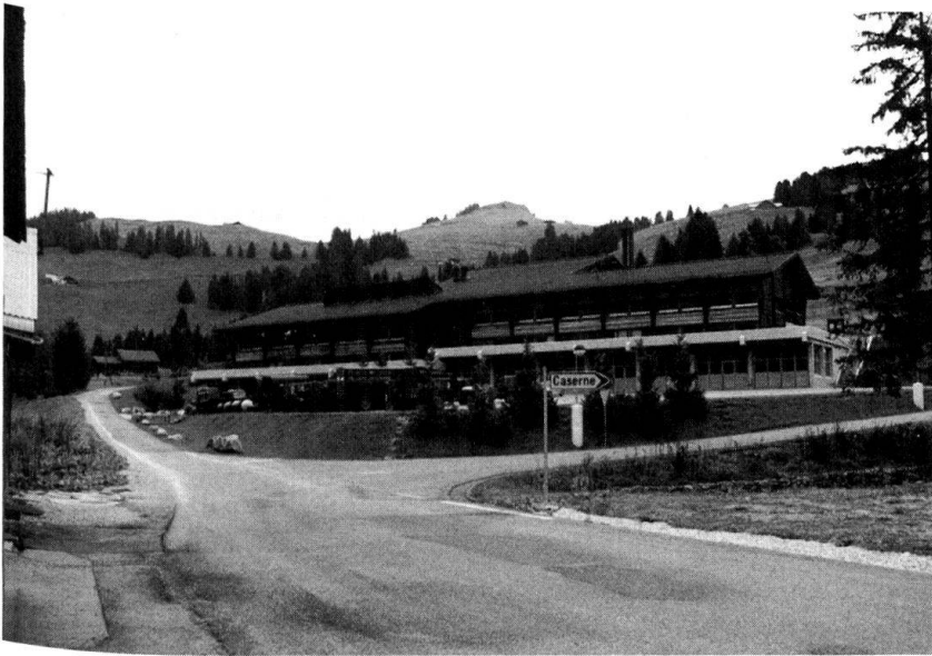
Le cantonnement de la Lécherette près du col des Mosses fait partie de la place de l'Hongrin.