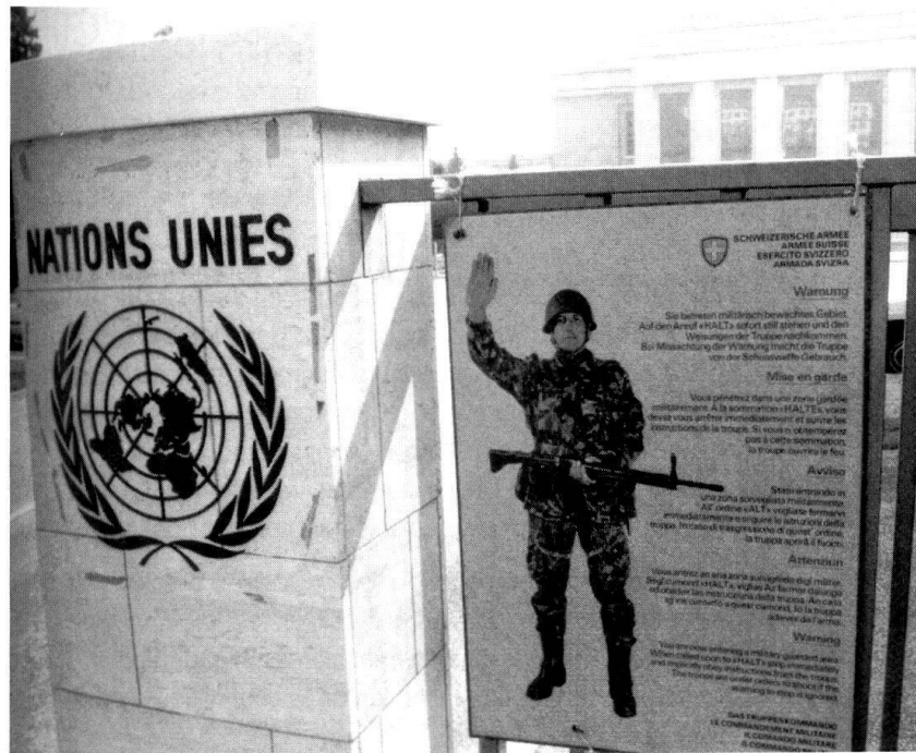
Des formes de collaboration nouvelles: service de garde à l'ONU, à Genève.

Les risques et dangers dans le domaine des Soft Security Issues (crime organisé, terrorisme, prolifération, environnement), qui attaquent la société aux défauts de sa cuirasse, s'ajoutent aux menaces militaires. Les attentats du 11 septembre en sont la démonstration. Dès lors, la sécurité doit être appréhendée