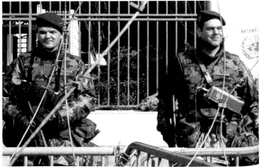
Service de surveillance aux Nations unies à Genève.

Dans la mesure où la situation de février – mars 1999 se répéterait (engagements subsidiaires d'appui au profit des re-