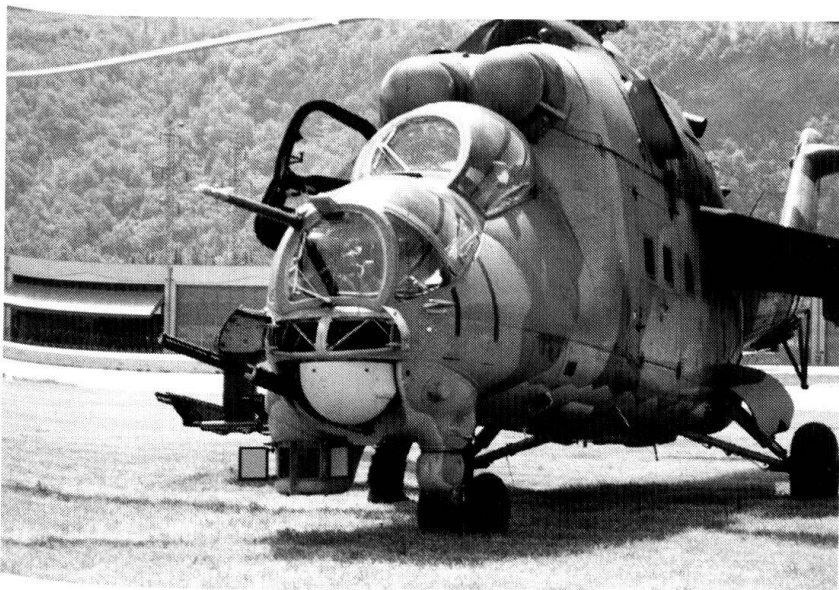
A part les forces nucléaires, l'armée russe, faute de crédits et de matériel apte à être engagé est peu opérationnelle. Ici un MI-24.

Il aurait décidé seul de se joindre à la coalition anti-terroriste menée par les Américains. Selon la kremlinologue du journal le Monde , « le moment décisif s'est produit au soir du 11 septembre (...) lorsque Poutine a eu le réflexe de téléphoner à Bush pour dire : 'Nous sommes avec les Américains'. A ce moment, il n'avait consulté personne. Plus tard, il est allé à Sochi 22 , il a réfléchi plusieurs jours et tenu des réunions avec des militaires, mais la décision était prise (...) Cela montre la confiance qu'il a en la solidité de son pouvoir. (...) le cas du Kosovo et le discours sur la Tchétchénie étaient