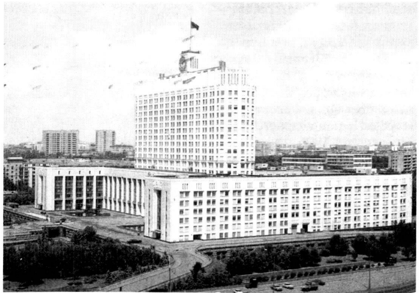
Moscou: la « Maison blanche », le bâtiment de la Douma.

On ignore presque tout des dix-huit ans de carrière au sein du KGB de Sergéï Ivanov, ministre de la Défense, sinon