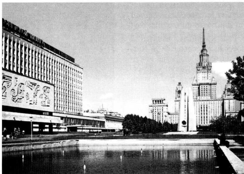
Moscou aux bâtiments très «staliniens»...

En 2000, 50000 soldats ont reçu une aide psychologique ou plutôt ce que l'on qualifie de telle, dans un pays où psycho-