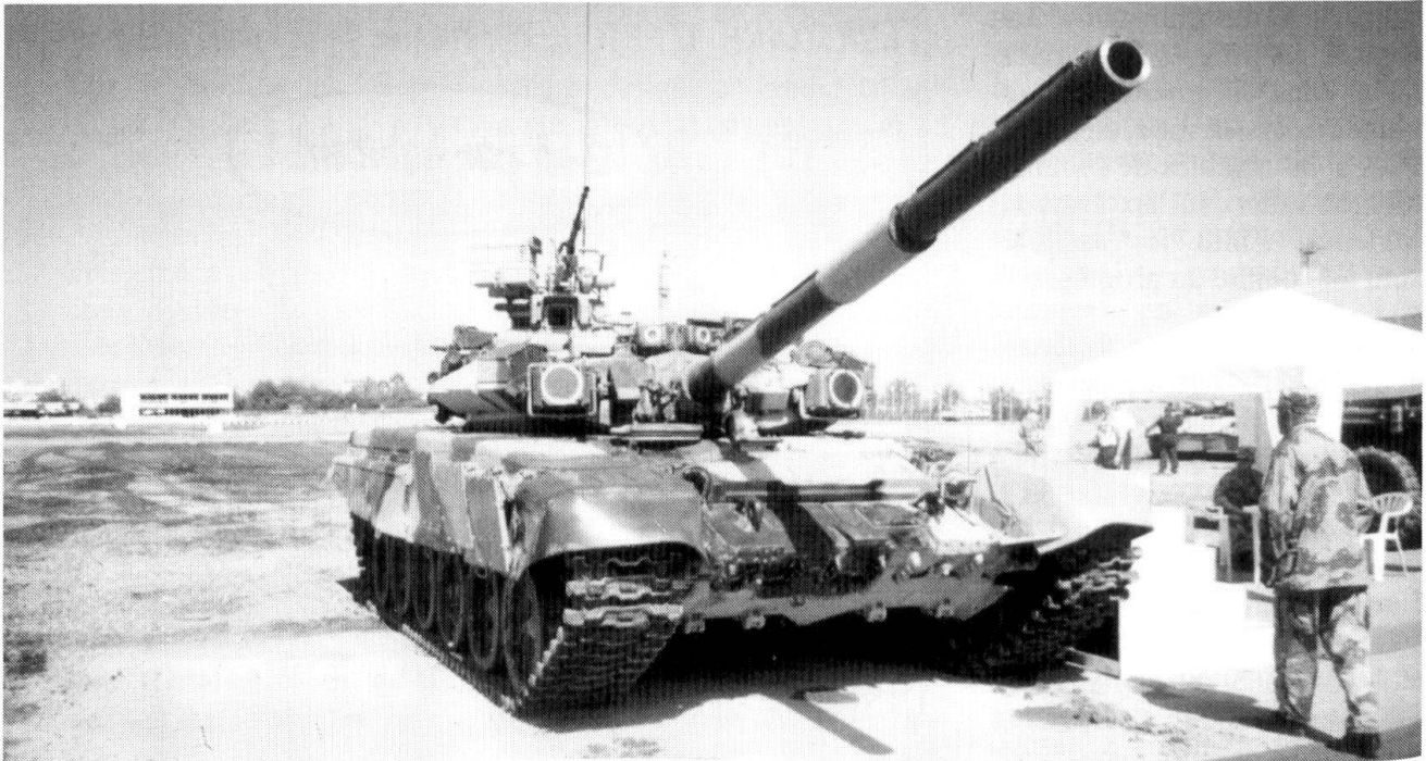
Le char de bataille russe T-90.