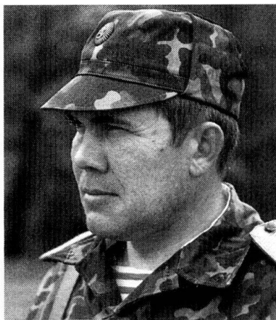
Le général Lebed, qui s'était lancé en politique, est mort récemment dans un accident d'hélicoptère.

Le général Alexandre Lebed, considéré comme un héros de la guerre d'Afghanistan, a signé les accords historiques de Khassaviourt ayant mis fin à la première guerre de Tchétchénie, dont il avait d'ailleurs dénoncé les exactions commises par les troupes russes. C'est aussi un ancien des troupes aéroportées. Il est devenu politicien et a décrit le processus avec amertume. «L'officier démobilisé se dit: 'J'ai servi pendant vingt ans, je me suis ruiné la santé et me suis sacrifié pour