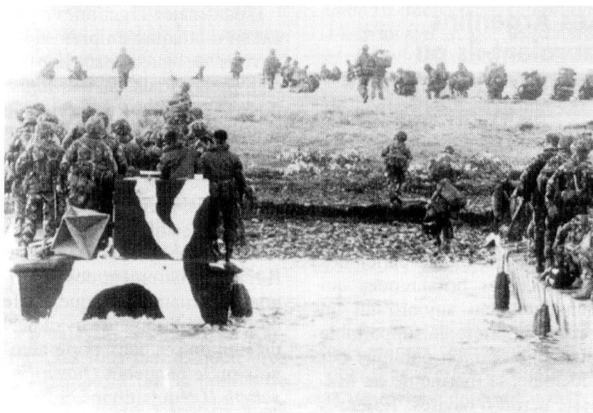
Débarquement à San Carlos, le 21 mai 1982.

C'est le Chili qui adopta l'attitude la plus inattendue à