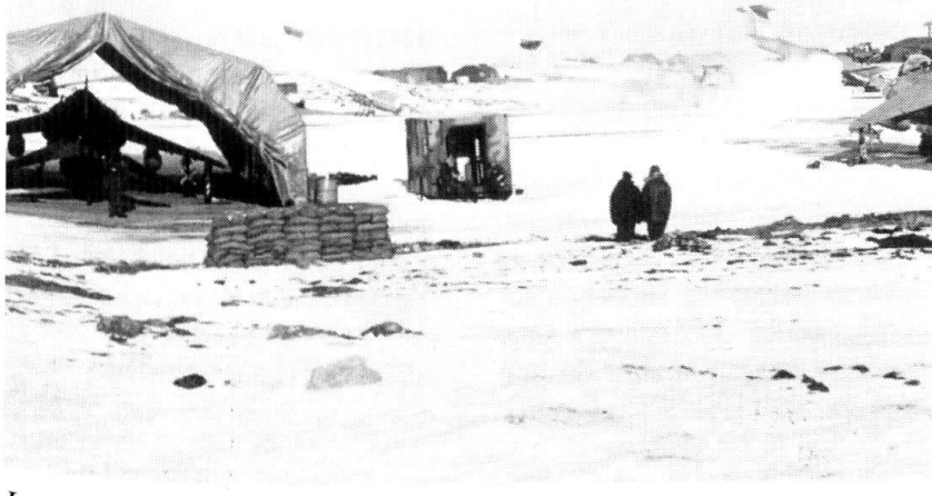
Les Britanniques maîtres à nouveau de la piste de Port Stanley, après les hostilités.

Les avocats des porte-aéronefs légers estiment que la flexibilité d'emploi et la fiabilité des avions de combat disposant d'une capacité de décollage et d'atterrissage vertical se sont avérées parfaitement adaptées en l'espèce. Ils soulignent surtout la faible disponibilité des avions embarqués à bord des derniers porte-avions lourds de la Royal Navy et leur inaptitude à opérer par très mauvais temps. Dans les conditions climatiques extrêmes qui régnaient alors en Atlantique Sud (visibilité très réduite, gîte du pont d'envol supérieure à 4 degrés), les Sea Harrier ont pu effectuer leurs missions là où les Phantom et les Buccaneer auraient été incapables de le faire. Et les pilotes de Sea Harrier s'adjugèrent 21 victoires, sans qu'aucun des leurs ne soit abattu par la chasse argentine. Le véritable artisan de la supériorité aérienne britannique fut cependant le missile air-air Sidewinder , dont la dernière version très performante pour l'époque (AIM-9L) fut livrée à la Fleet Air Arm , juste avant le début des hostilités. Sans ce missile (crédité de 18 victoires sur 21), les pilotes britanniques n'auraient jamais pu stopper les raids argentins comme ils furent en mesure de le faire.