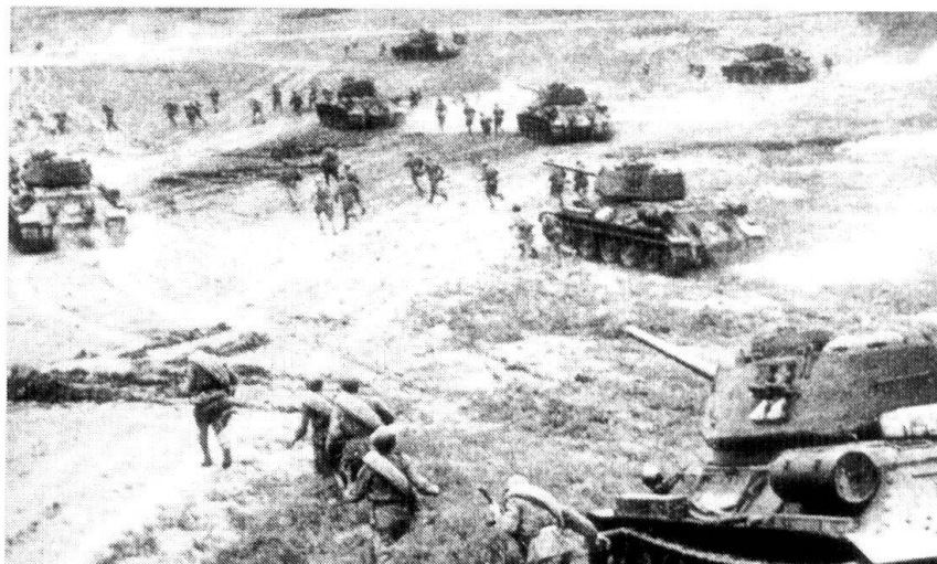
1944 : des troupes soviétiques s'approchent de Varsovie. Des libérateurs ou des occupants ?

On peut se demander si un tel endoctrinement a donné les résultats attendus et pendant combien de temps ? Difficile de répondre à cette question vu l'absence de recherches dignes