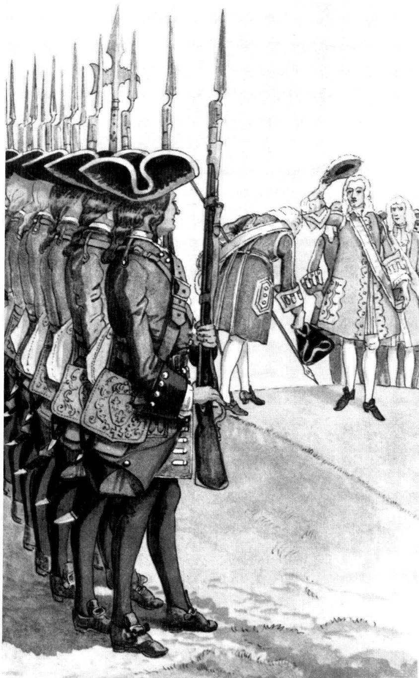
Régiment suisse de Chandieu-Villars au service de France, Ordonnance de 1701. Mousquetaires, au fond des officiers supérieurs.